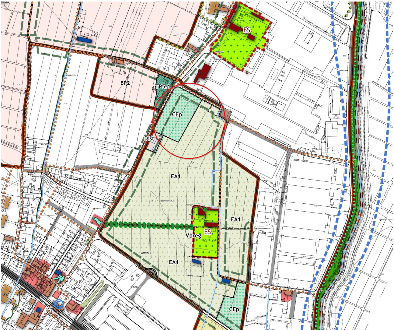
Figura 1: Piano Operativo vigente – tav. 1.2 Territorio rurale sud