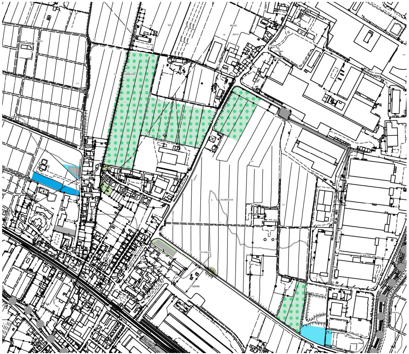
Figura 4: Piano Operativo vigente - Tav.4 Espropri