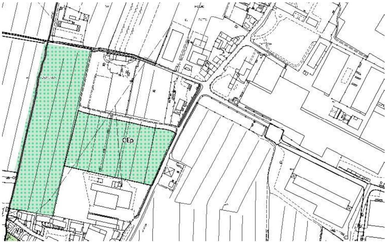
Figura 7: Estratto tav. 4 Variante Piano Operativo