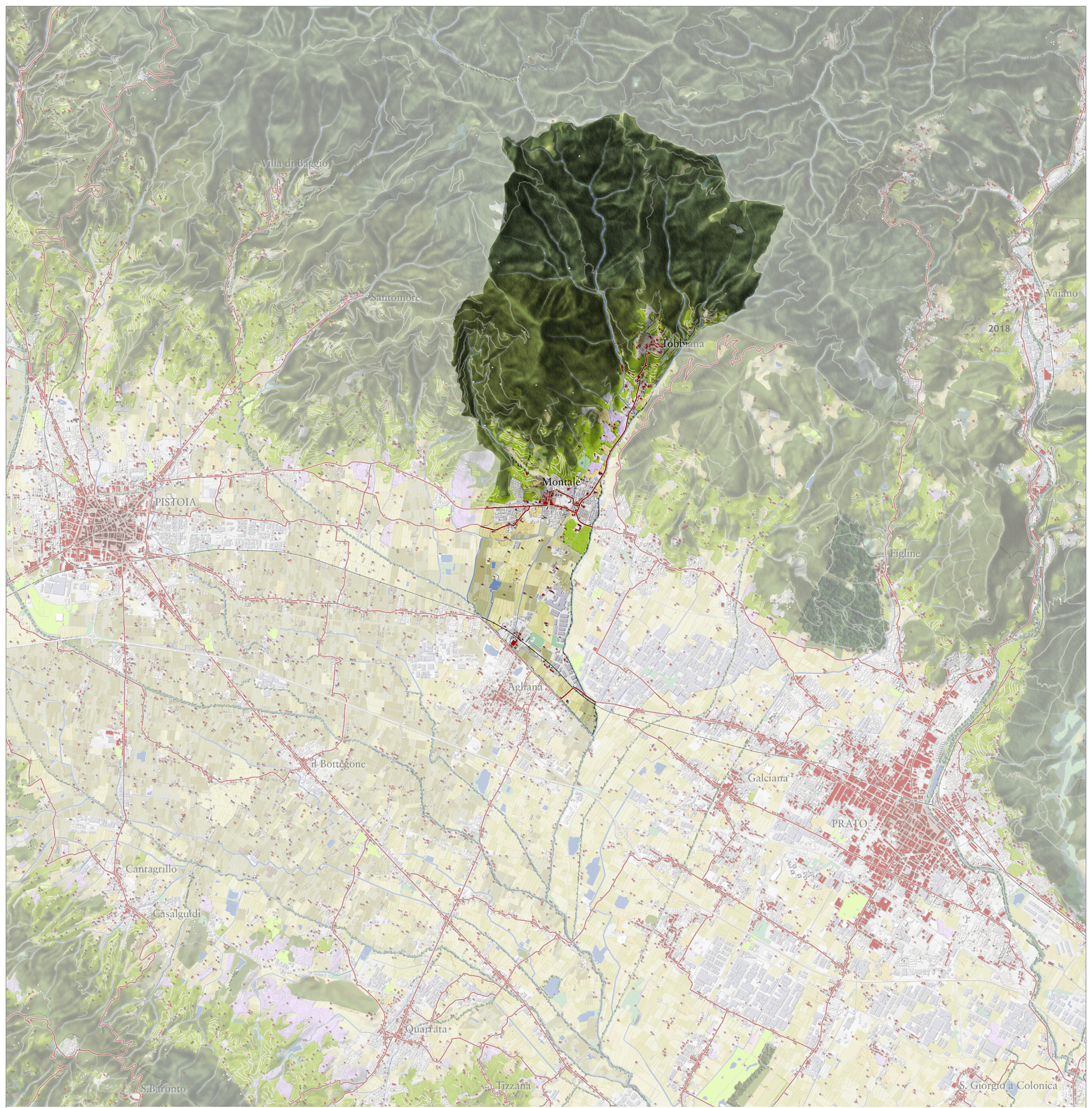
Scheda d'Ambito 06 del PIT/PPR