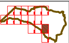
TAVOLA 16 21142

CLASSIFICAZIONE ACUSTICA DEL TERRITORIO Piano Comunale di Classificazione Acustica Legge Regionale n° 89/98 Art. 2