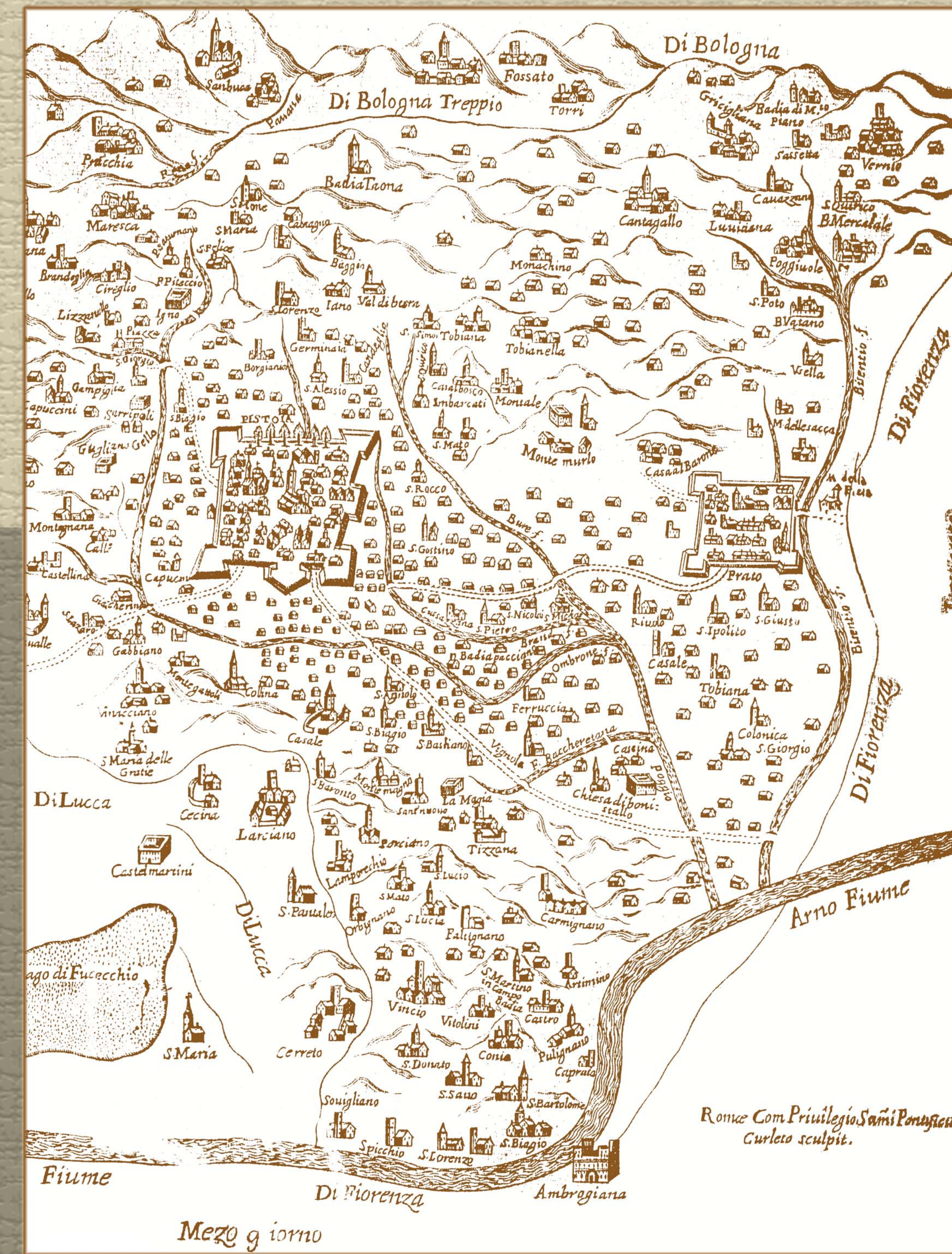
carta della Diocesi di Pistoia, 1727 (archivio vescovile, pistoia)