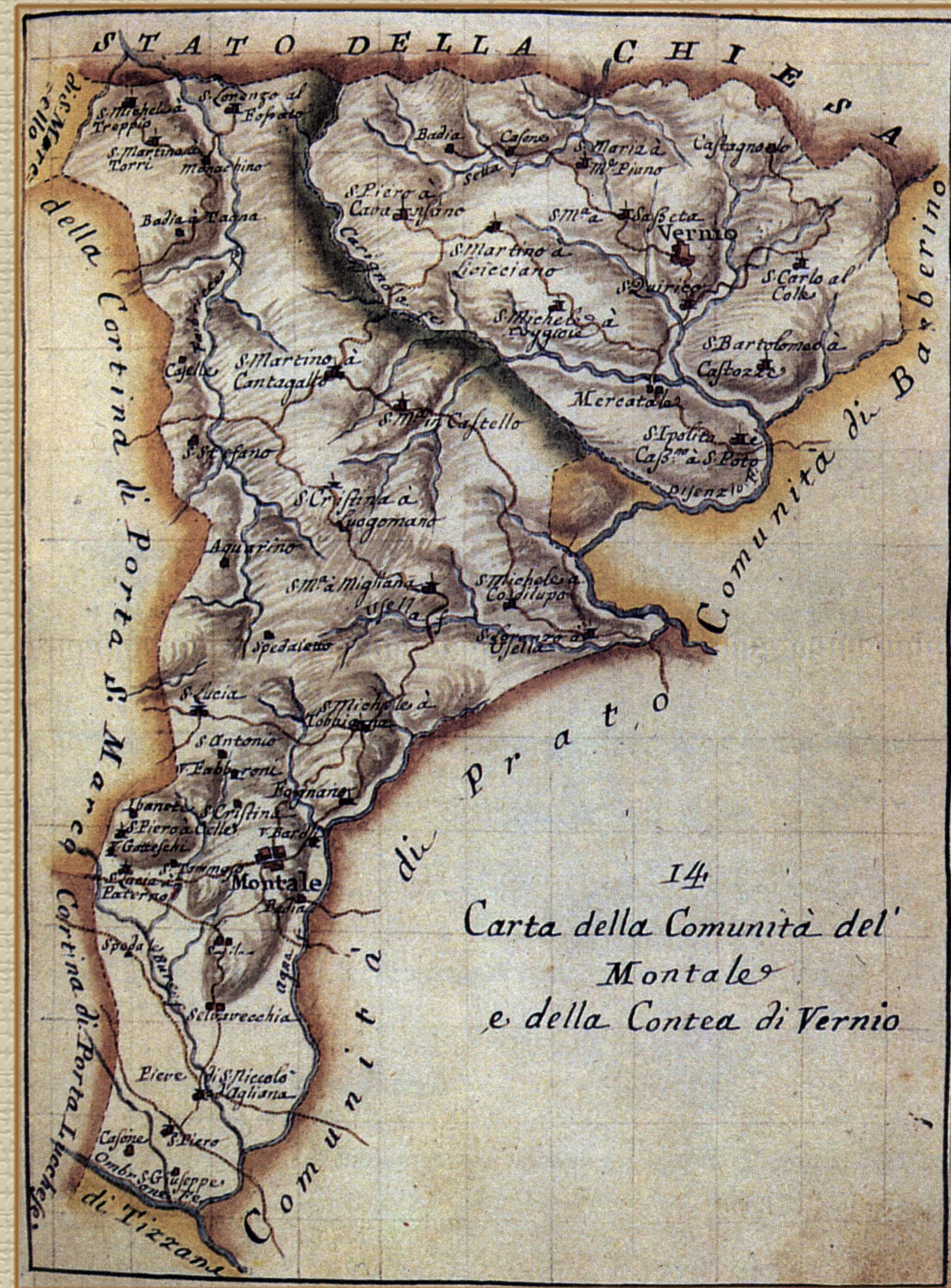
carta della Comunità di Montale, sec XVIII (biblioteca Nazionale Centrale di Firenze, fondo Cappugi)