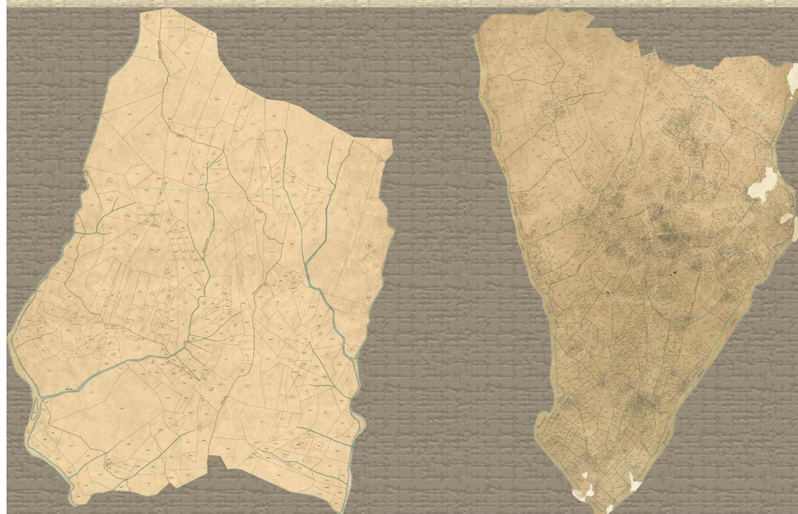
mappe dell'antico catasto, (Archivio di Stato di Pistoia)