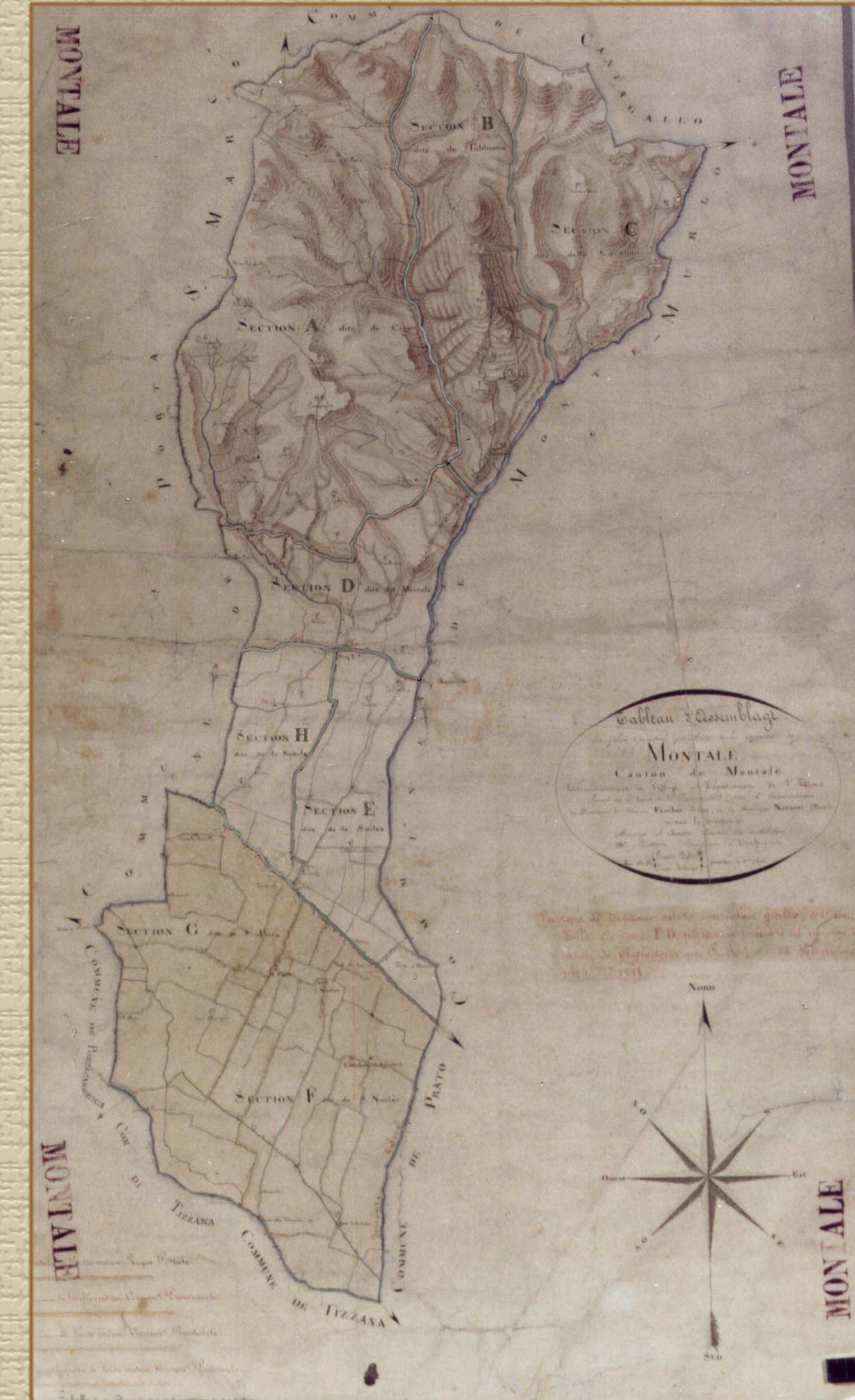
quadro di unione dell'antico catasto, 1813 (Archivio di Stato di Pistoia)