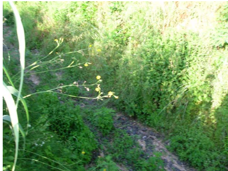
Foto 126 – T. Settola: punto di ripresa sull'argine sx in corrispondenza della sezione SE2112__, da monte verso valle