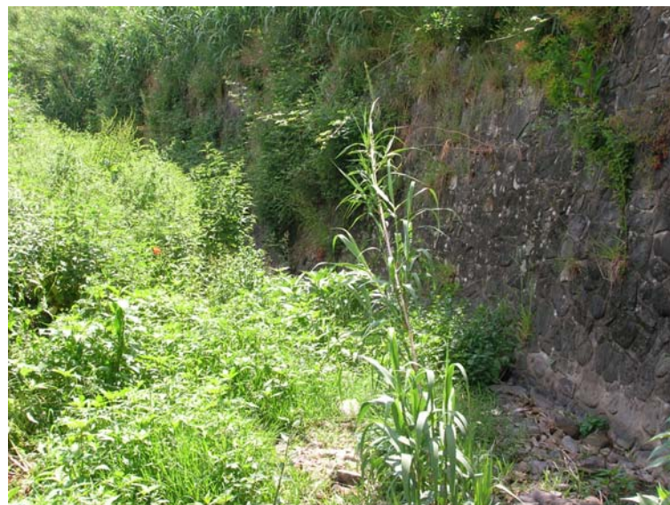
Foto 108 – T. Settola: punto di ripresa in corrispondenza della sezione SE2104__, da monte verso valle