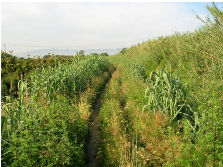
Foto 127 - T. Settola: foto dell'argine sx in corrispondenza della sezione SE2113__, da monte verso valle_