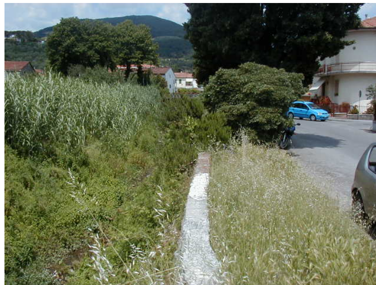
Foto 48 - T. Settola: punto di ripresa in corrispondenza della sezione SE2046__, da valle verso monte