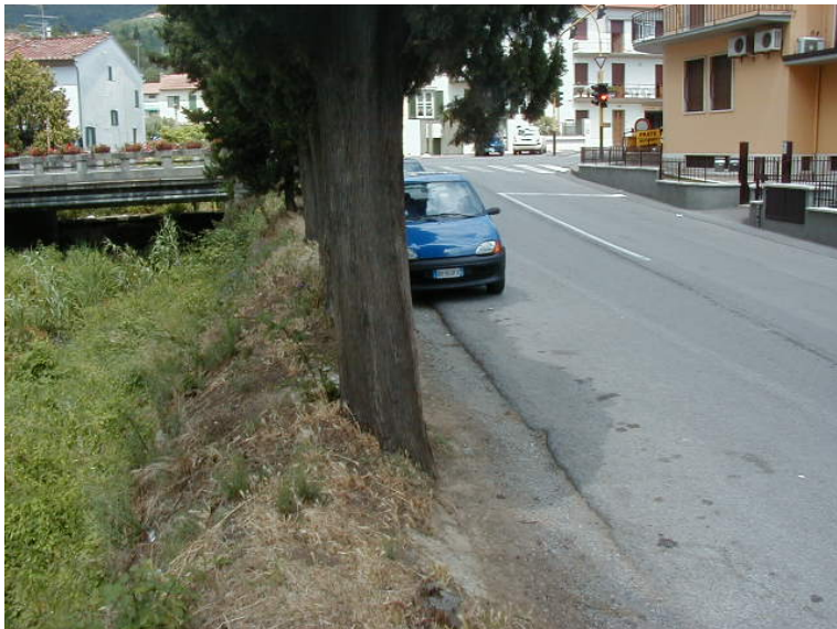
Foto 45 – T. Settola: ponte su via IV Novembre (sezione SE2039C_), sponda dx vista da valle