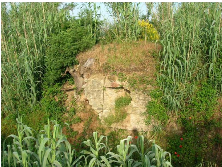
Foto 111 - T. Settola: manufatto in sponda dx in corrispondenza della sezione SE2106__