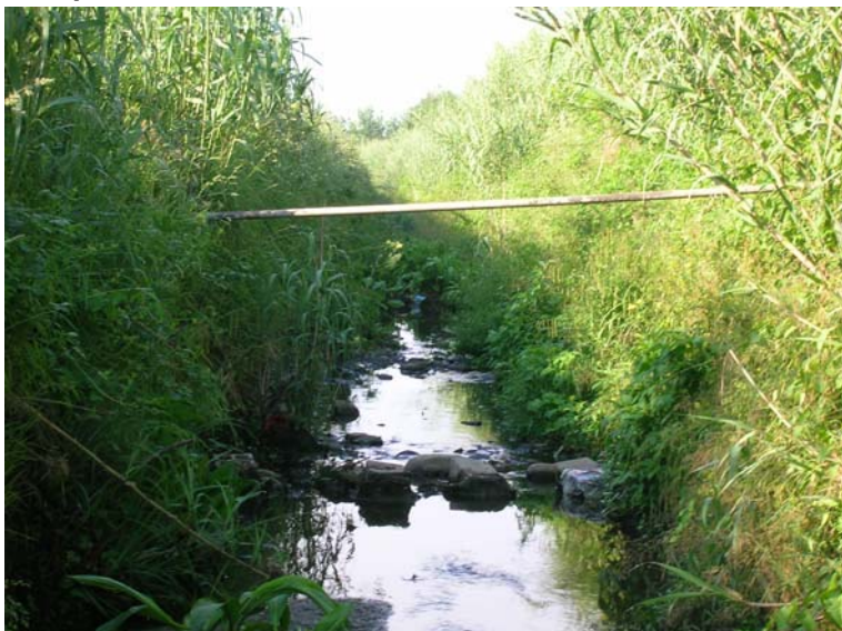
Foto 131 - T. Settola: attraversamento di tubo (sezione SE2117B_) visto da monte verso valle