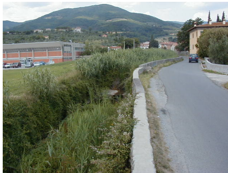
Foto 56 - T. Settola: sponda dx ripresa dalla sezione SE2056__ (da valle verso monte)