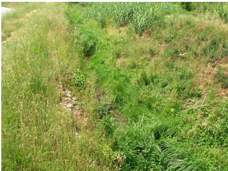
Foto 83 – T. Settola: punto di ripresa in corrispondenza della sezione SE2084__, da monte verso valle