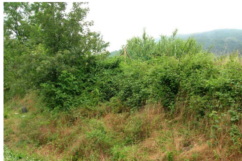
Foto 8- T. Settola: area in sponda sx a monte della sezione SE2005__