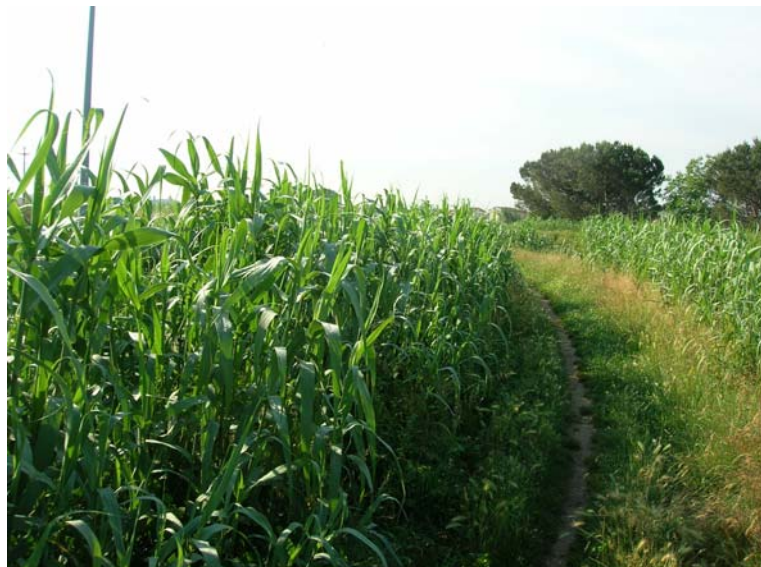
Foto 133 – T. Settola: foto dell'argine sx in corrispondenza della sezione SE2120__ , da monte verso valle