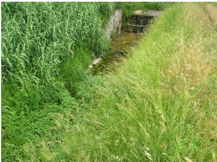
Foto 79 – T. Settola: briglia SE2080B_ vista dall'argine sx all'altezza della sezione SE2081__