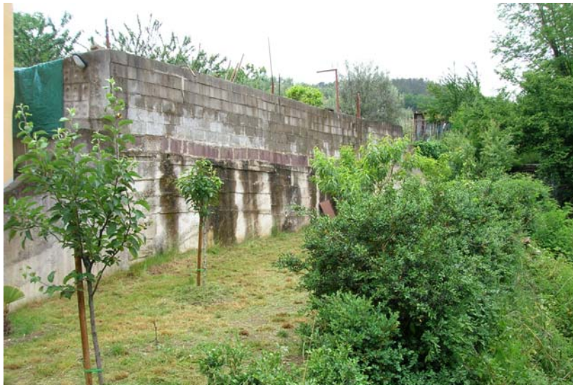
Foto 5 – T. Settola: area in sponda dx a monte della Passerella di foto 4