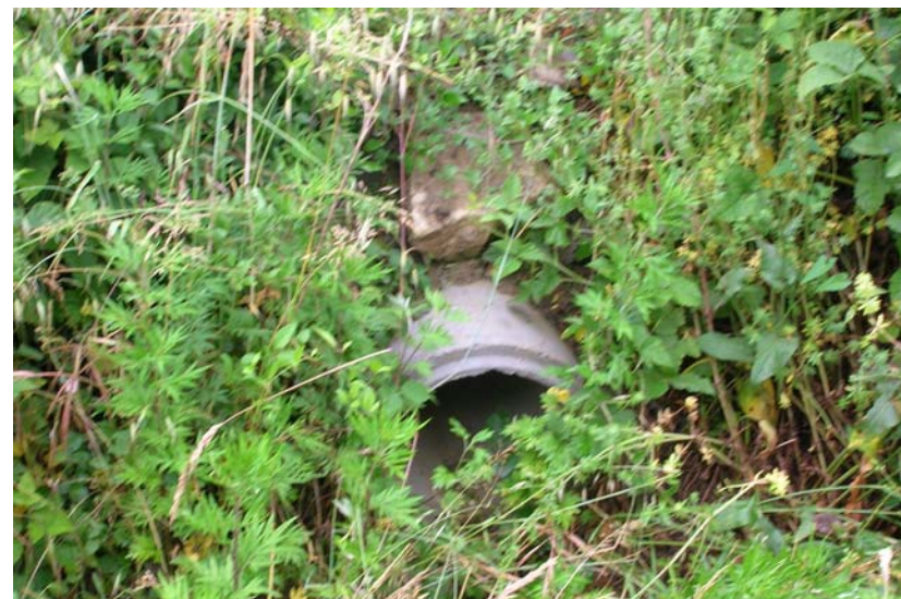
Foto 16- T. Settola: ingresso in sponda sx di tubo \phi 300 mm in corrispondenza della sezione SE2009_