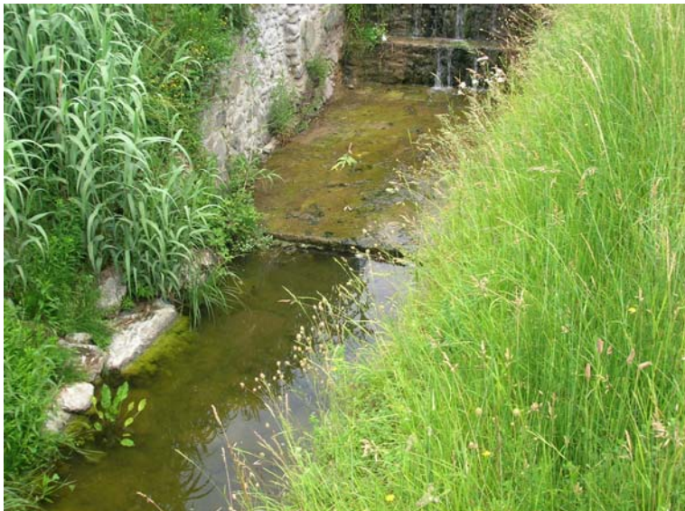
Foto 77 – T. Settola: briglia SE2080B_ vista dall'argine sx all'altezza della sezione SE2081__