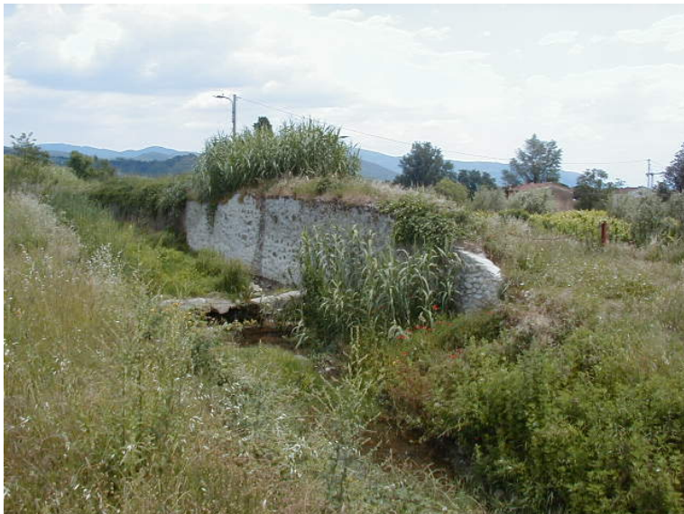
Foto 73 – T. Settola: briglia SE2070B_ vista dall'argine dx all'altezza della sezione SE2072__