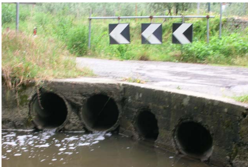
Foto 19 – T. Settola: attraversamento via del Castagno sezione S2015C_ (valle)