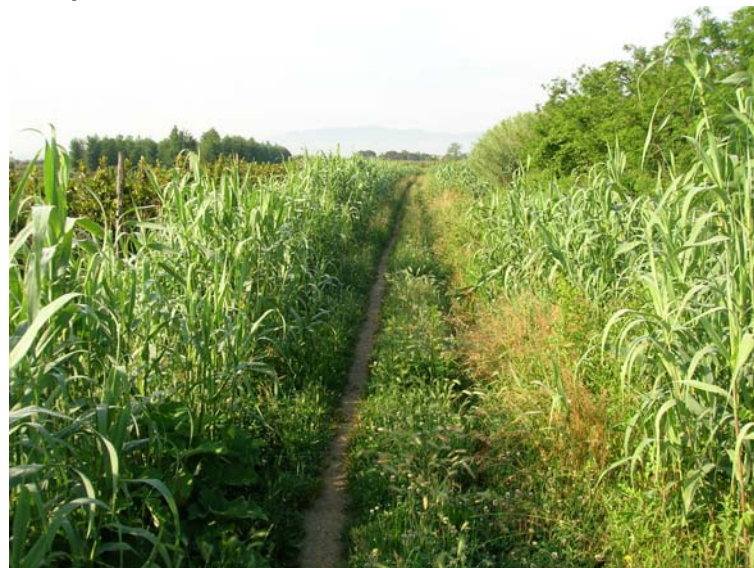
Foto 124 – T. Settola: foto dell'argine sx in corrispondenza della sezione SE2112__ , da monte verso valles