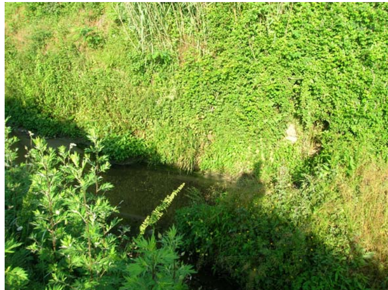
Foto 130 – T. Settola: punto di ripresa sull'argine sx in corrispondenza della sezione SE2115__, da monte verso valle