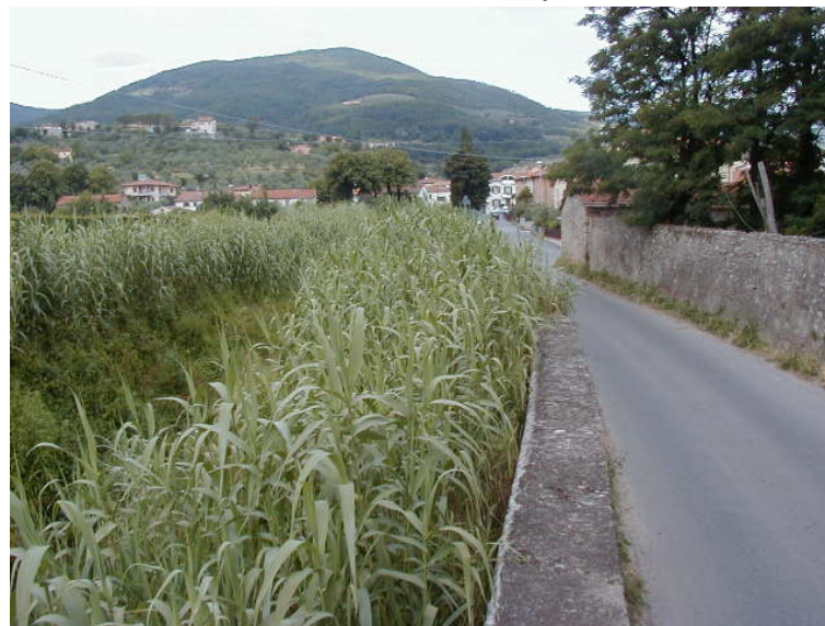
Foto 52 - T. Settola: sponda dx ripresa dalla sezione SE2051__ (da valle verso monte)