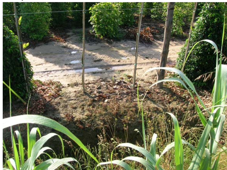
Foto 128 – T. Settola: foto dall'argine sx nell'area limitrofa alla SE2113__ sede di vivaio