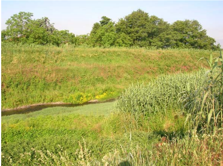
Foto 137 – T. Settola: confluenza nel T. Bure vista dall'argine dx del T. Settola