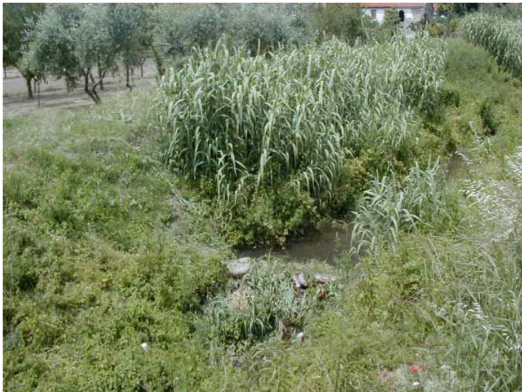
Foto 49 – T. Settola: briglia in corrispondenza della sezione SE2047B_