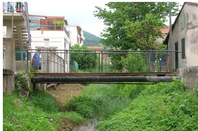
Foto 36 - T. Settola: passerella di via Ferrucci (sez. SE2033A_), visto da valle