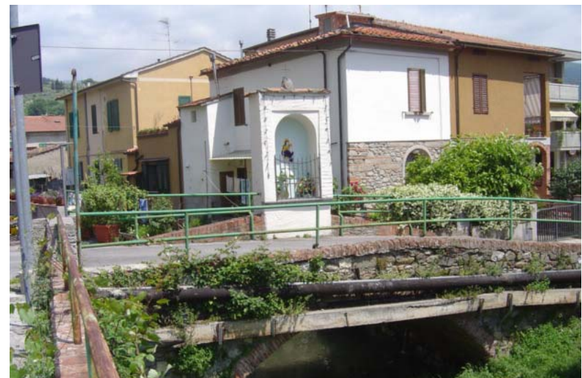
Foto 32- T. Settola: ponte di via Nerucci visto da valle (sez. SE2027C_)