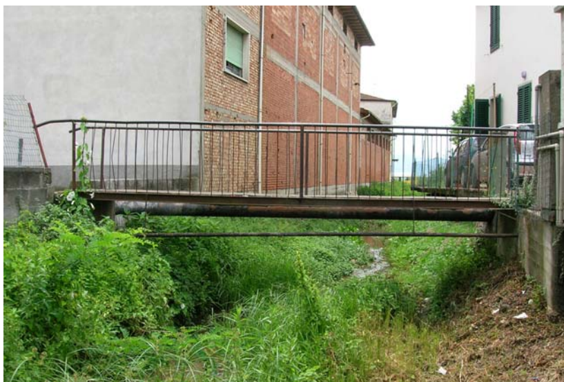
Foto 35 – T. Settola: passerella di via Ferrucci (sez. SE2033A_), visto da monte