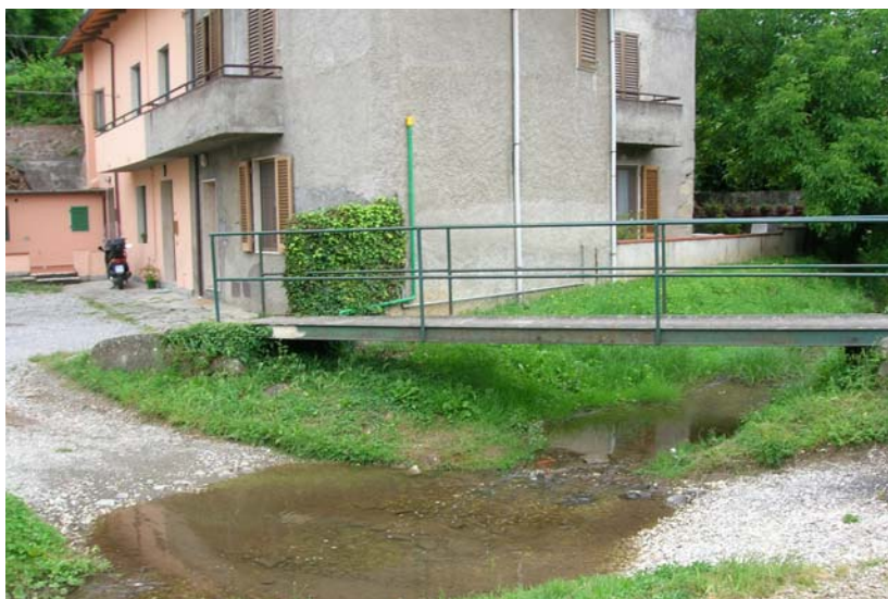
Foto 23 – T. Settola: attraversamento in corrispondenza della sezione SE2019A_ visto da valle