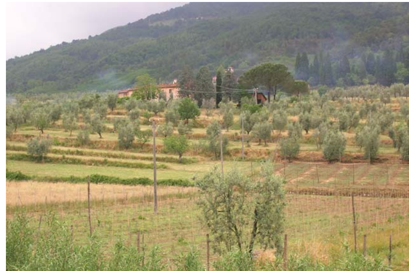
Foto 14 – T. Settola: area posta in sponda sx fotografata in corrispondenza della sezione SE2008__