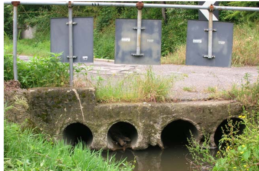
Foto 18 – T. Settola: attraversamento via del Castagno sezione S2014B_ (monte)