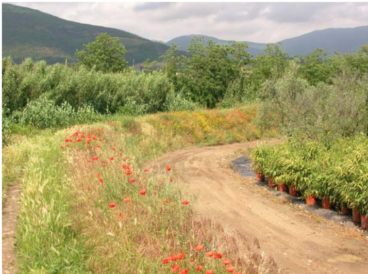
Foto 109 – T. Settola: area in sx idrografica alla sezione SE2104__