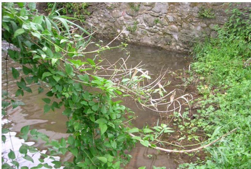
Foto 27 – T. Settola: sezione SE2023__, fotografata dalla sponda dx da valle verso monte