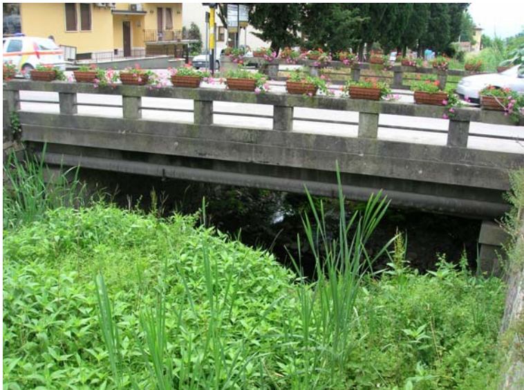
Foto 41 – T. Settola: ponte su via IV Novembre (sezione SE2038A_), visto da monte