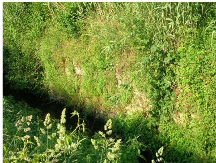
Foto 132 – T. Settola: punto di ripresa sull'argine sx in corrispondenza della sezione SE2119__, da monte verso valle