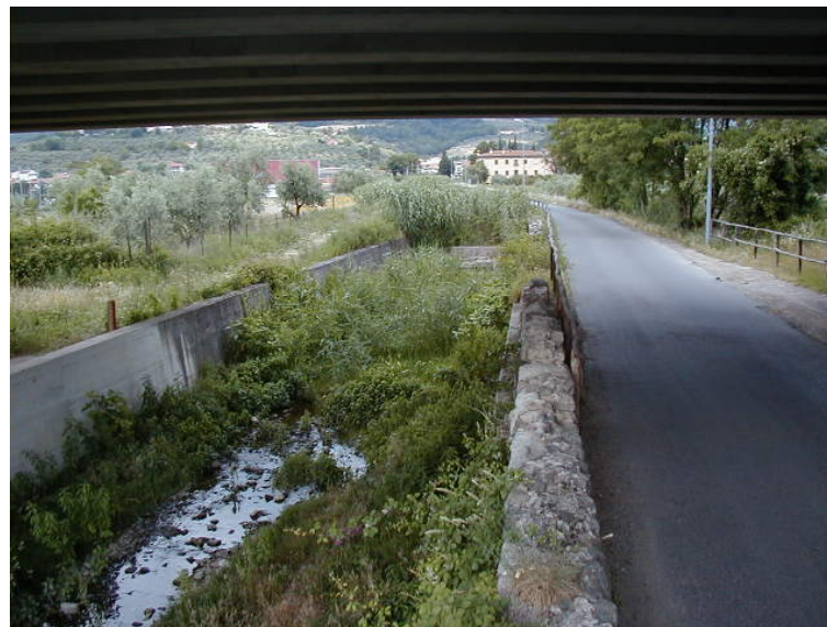
Foto 64 - T. Settola: tratto a valle della briglia SE2064B_ ripresa dal ponte su via Berlinguer (SE2066__)