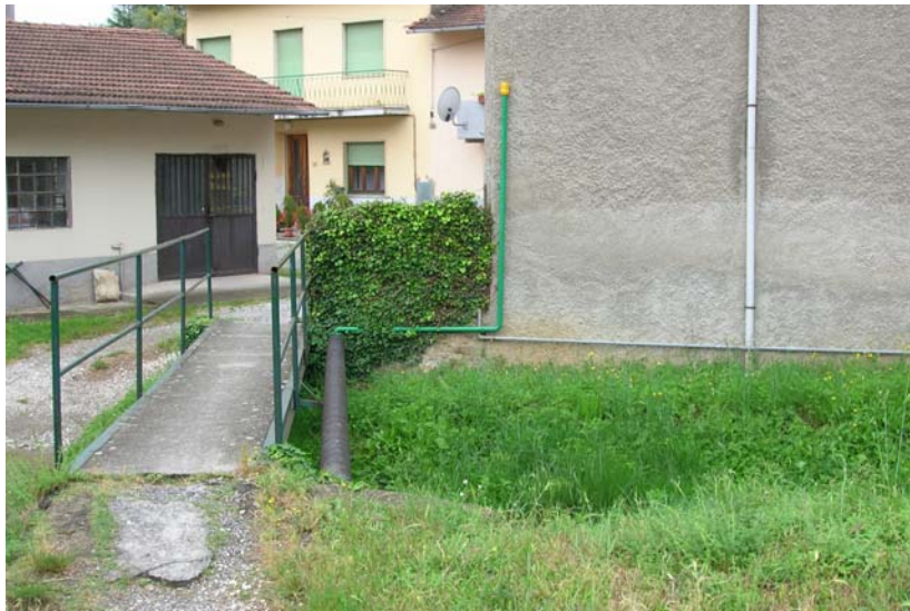
Foto 21 – T. Settola: attraversamento in corrispondenza della sezione SE2019A_