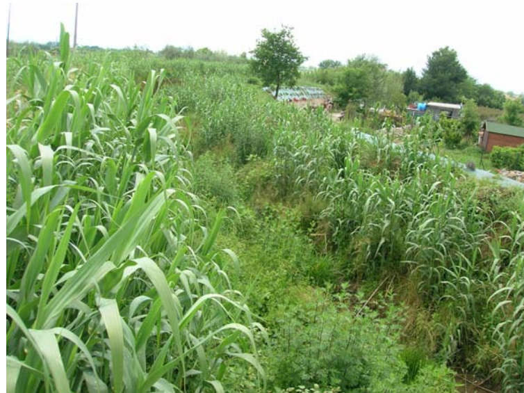
Foto 90 - Settola: sponda dx in corrispondenza della sezione SE2089__