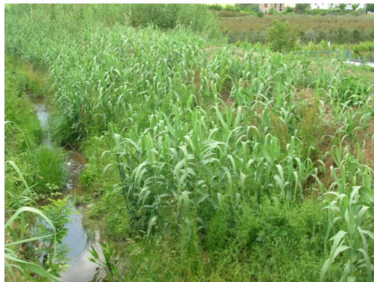
Foto 92 – T. Settola: punto di ripresa in corrispondenza della sezione SE2090__, da monte verso valle