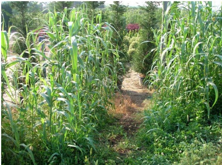
Foto 121 – T. Settola: foto dall'argine sx nell'area limitrofa alla SE2111__ sede di vivaio