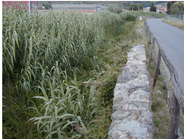
Foto 58 – T. Settola: sponda dx ripresa dalla sezione SE2058__ (da valle verso monte)