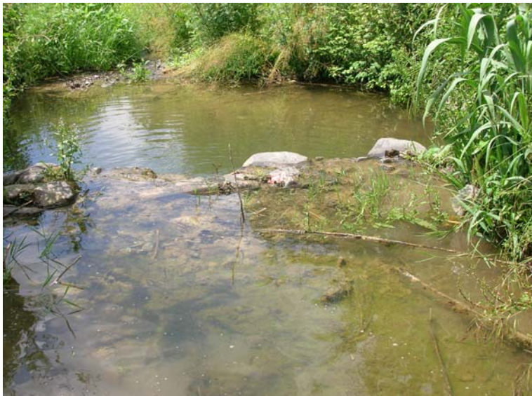
Foto 93 – T. Settola: briglia alla sezione SE2091A_ vista da monte