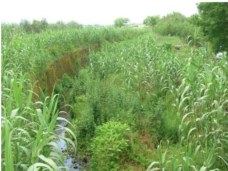
Foto 91 - T. Settola: punto di ripresa in corrispondenza della sezione SE2089__, da monte verso valle