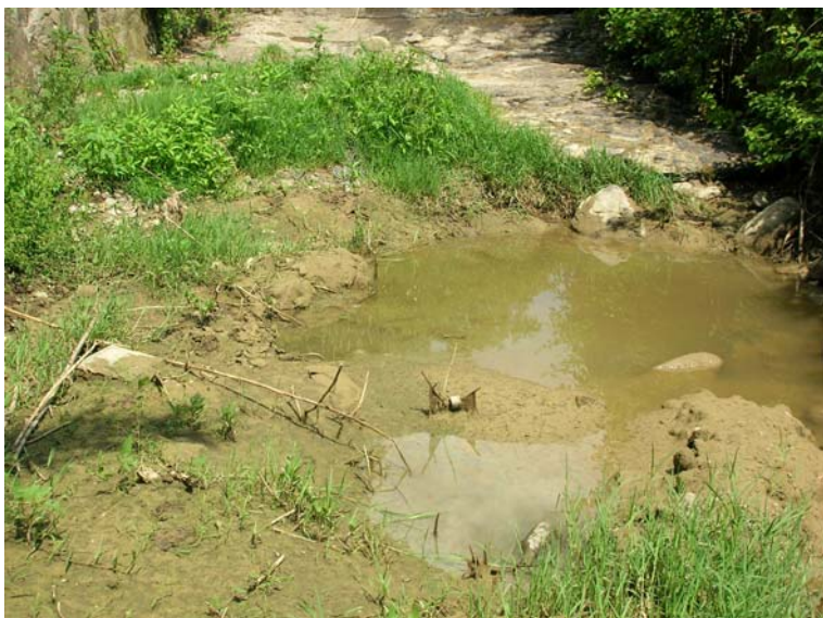
Foto 107 - T. Settola: tratto a valle della briglia visto dalla sezione SE2103__ (da valle verso monte)