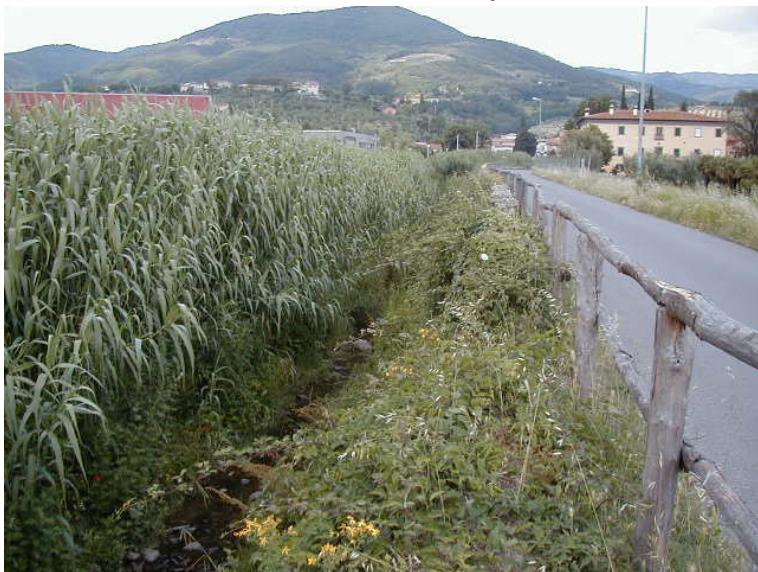
Foto 59 – T. Settola: sponda dx ripresa dalla sezione SE2059__ (da valle verso monte)