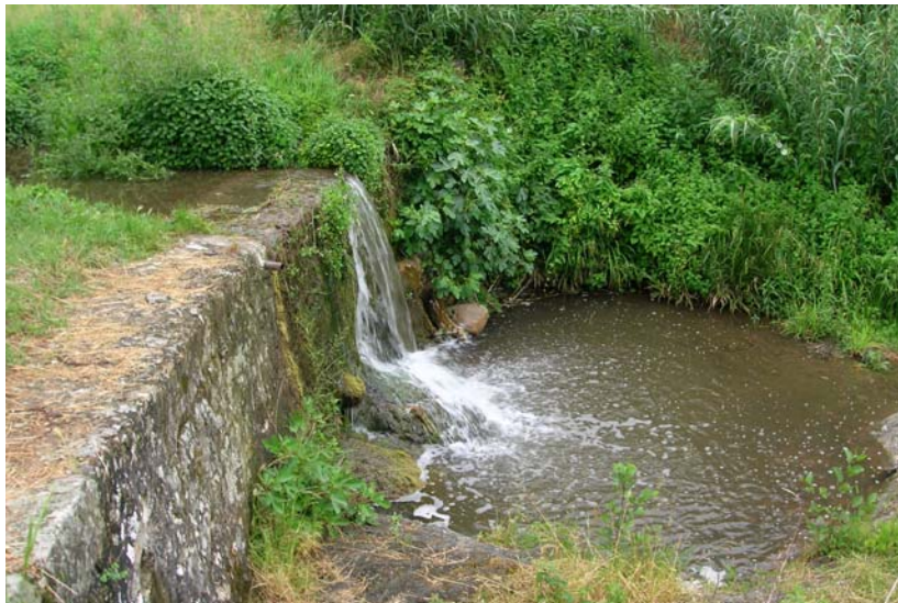
Foto 13 – T. Settola: briglia in corrispondenza della sezione SE2007A_