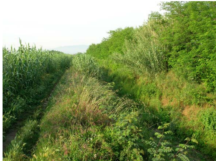
Foto 122 – T. Settola: punto di ripresa sull'argine sx in corrispondenza della sezione SE2111__, da monte verso valle