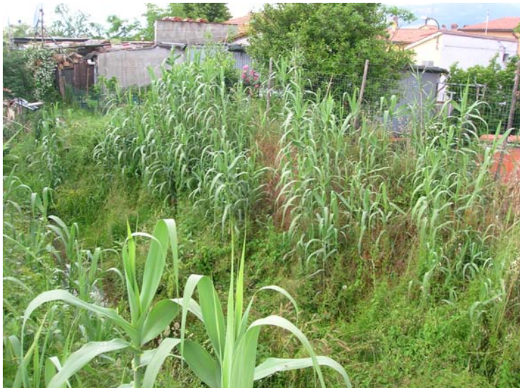
Foto 89 – T. Settola: sponda dx in corrispondenza della sezione SE2088__