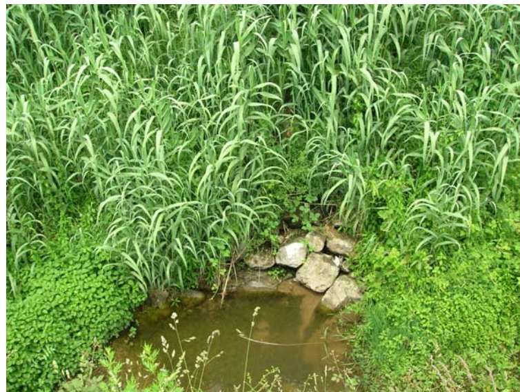
Foto 80 - T. Settola: scarico in dx all'altezza della sezione SE2081__ ( \phi circa 0.5m)