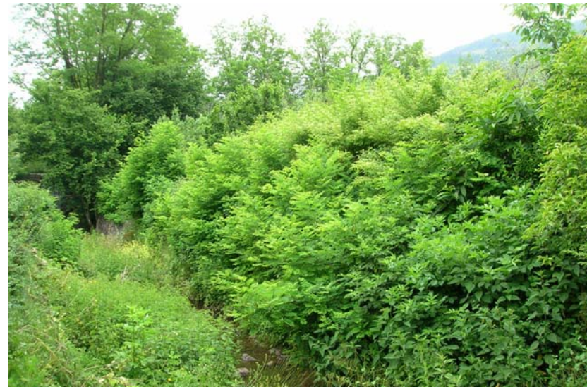
Foto 6 – T. Settola: area in sponda sx a monte della Passerella di foto 4