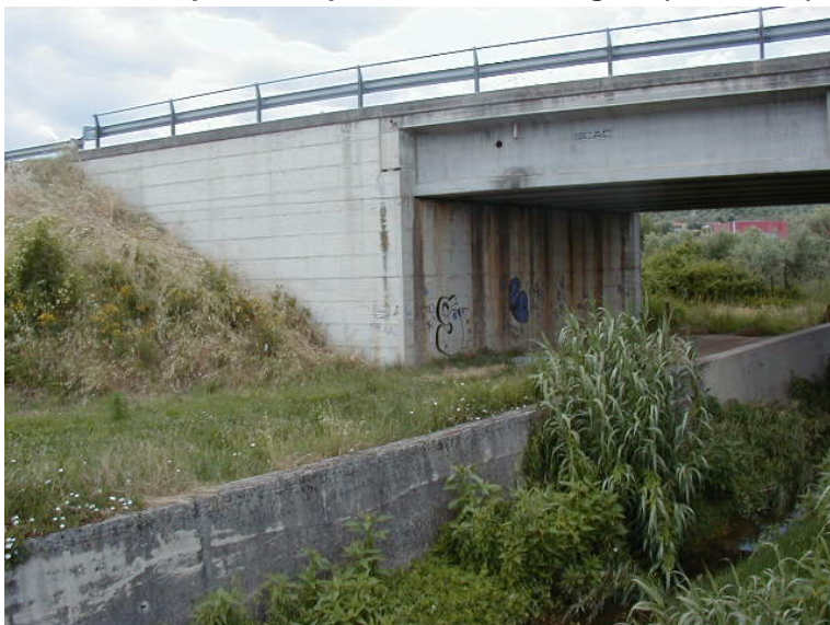
Foto 67 – T. Settola: sponda dx a valle del ponte su via Berlinguer