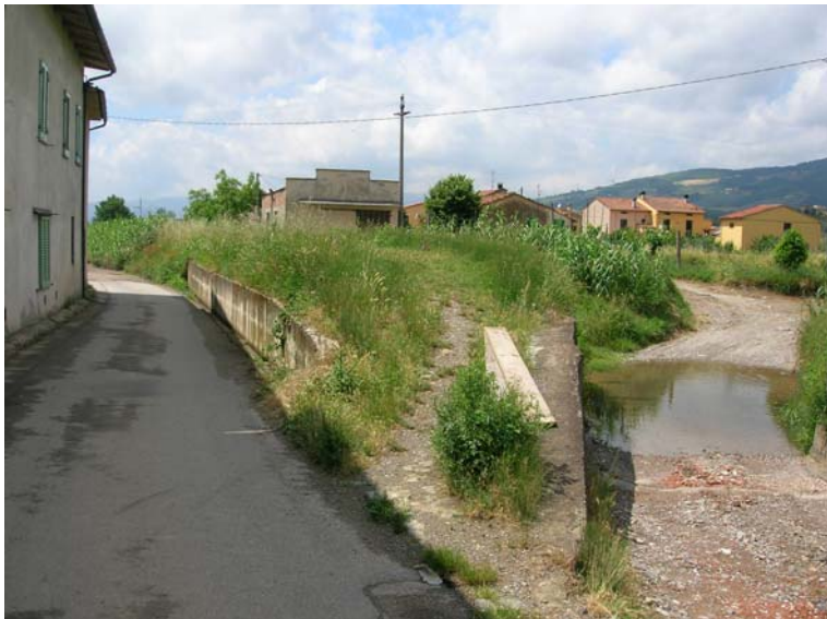
Foto 85 – T. Settola: guado visto da via Papini (sezione SE2086__)