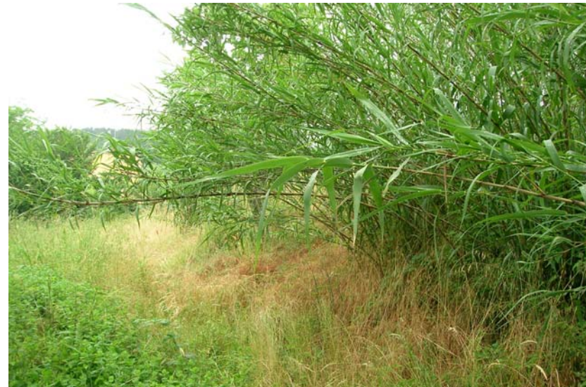
Foto 10 – T. Settola: area in sponda sx a monte della sezione SE2006__