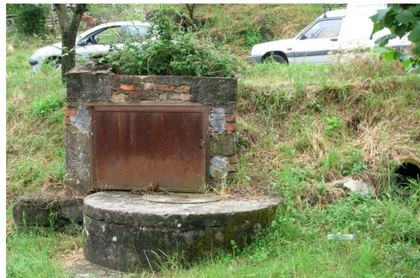
Foto 12- T. Settola: pozzo in sponda dx a monte della briglia alla sezione SE2007A_