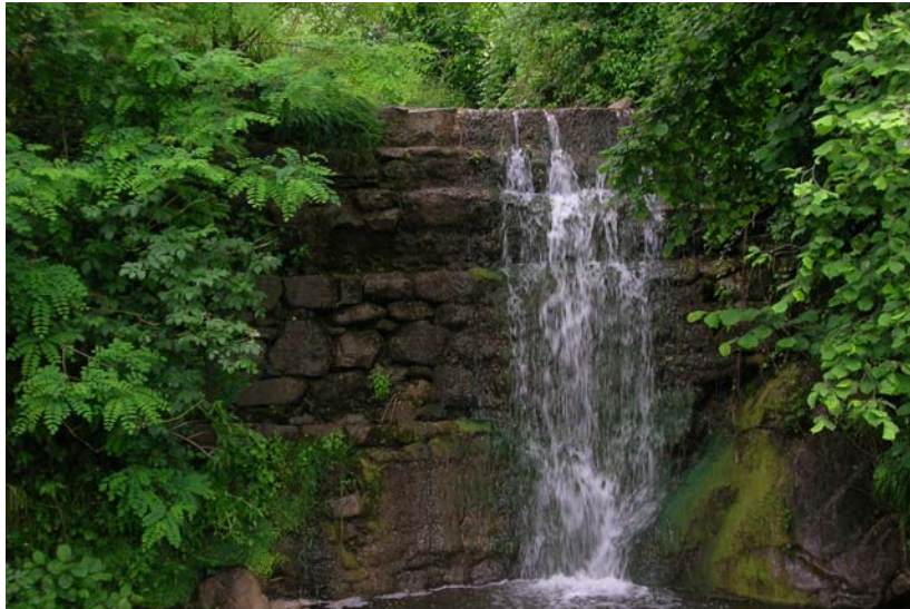
Foto 1 – T. Settola: briglia in corrispondenza della sezione SE2002____