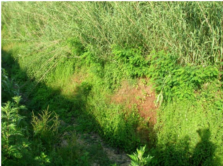
Foto 129 – T. Settola: punto di ripresa sull'argine sx in corrispondenza della sezione SE2113__, da monte verso valle