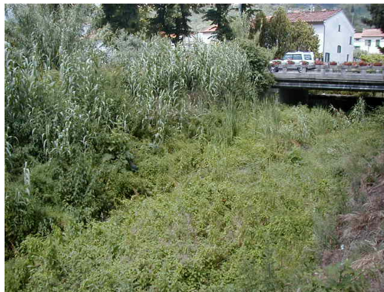
Foto 44 - T. Settola: ponte su via IV Novembre (sezione SE2039C_), visto da valle