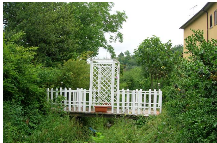
Foto 4- T. Settola: passerella alla sezione SE2004B_ vista da monte