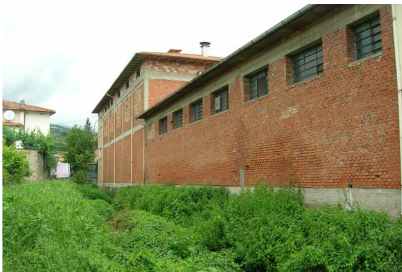
Foto 39 – T. Settola: punto di ripresa in corrispondenza della sezione SE2036A_, da valle verso monte