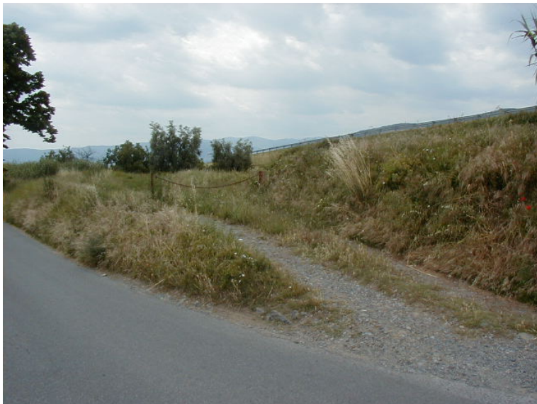
Foto 69 – T. Settola: accesso all'argine sx in corrispondenza della sezione SE2070A_