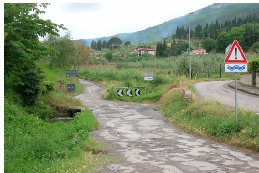
Foto 20- T. Settola: attraversamento via del Castagno visto a valle della sezione S2015C_