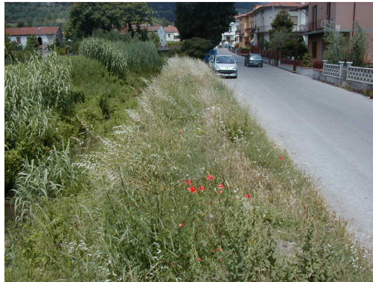
Foto 50 – T. Settola: sponda dx ripresa dalla briglia di foto 49 (da valle verso monte)