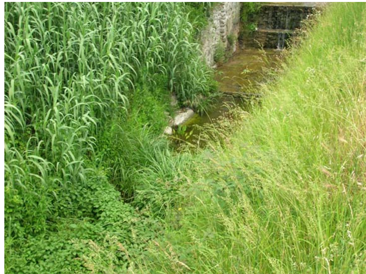
Foto 78 – T. Settola: briglia SE2080B_ vista dall'argine sx all'altezza della sezione SE2081__