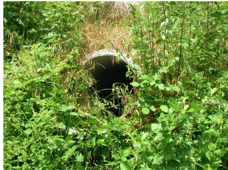
Foto 82 – T. Settola: scarico in sponda dx in corrispondenza della sezione SE2082__ ( \phi 0.58m)