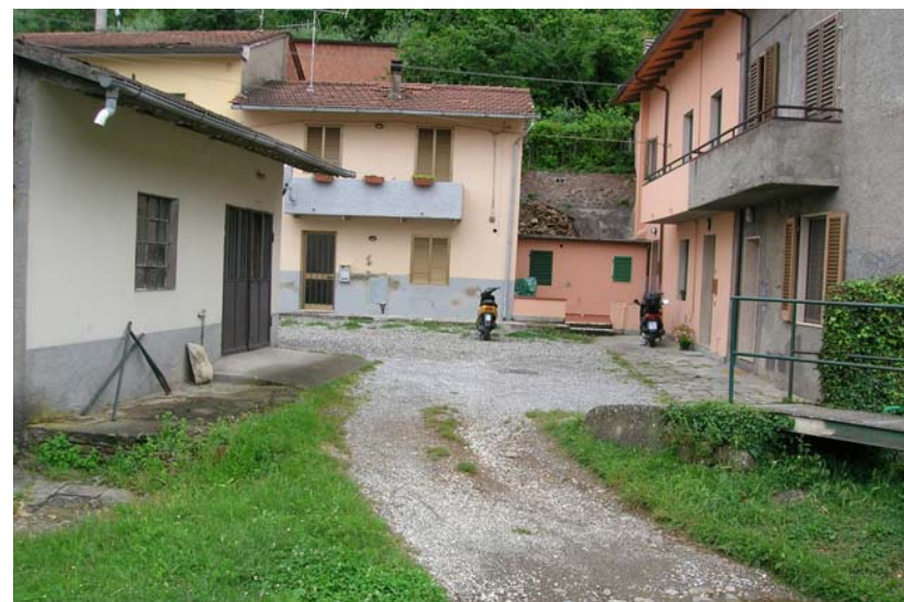
Foto 24- T. Settola: guado in sponda dx a valle della sezione SE2019A_