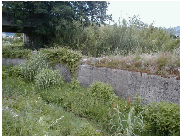
Foto 66 – T. Settola: sponda sx a valle del ponte su via Berlinguer