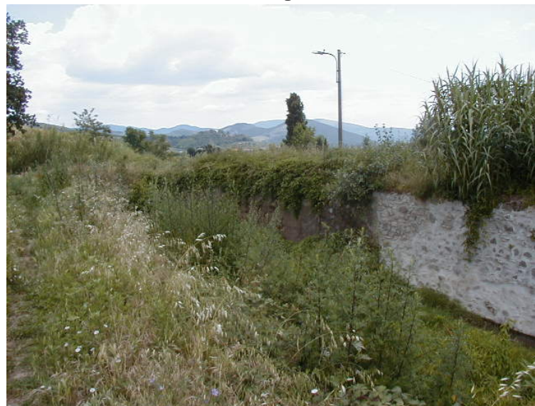
Foto 68 - T. Settola: sponda sx in corrispondenza della sezione SE2069__ da valle verso monte