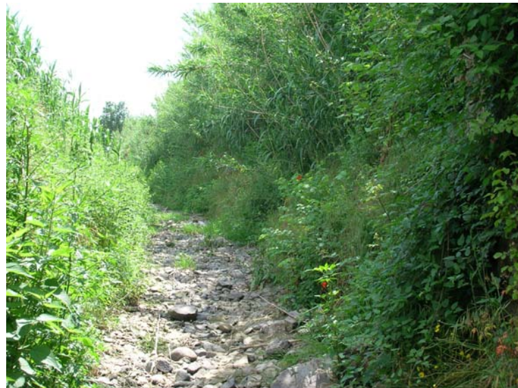
Foto 110 – T. Settola: punto di ripresa in corrispondenza della sezione SE2105__, da monte verso valle