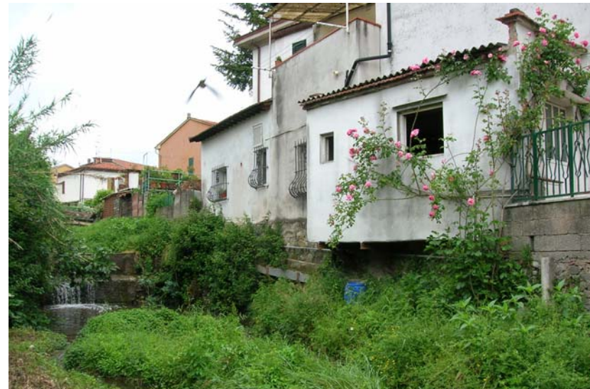
Foto 34 – T. Settola: tratto a valle della briglia sezione SE2029B_