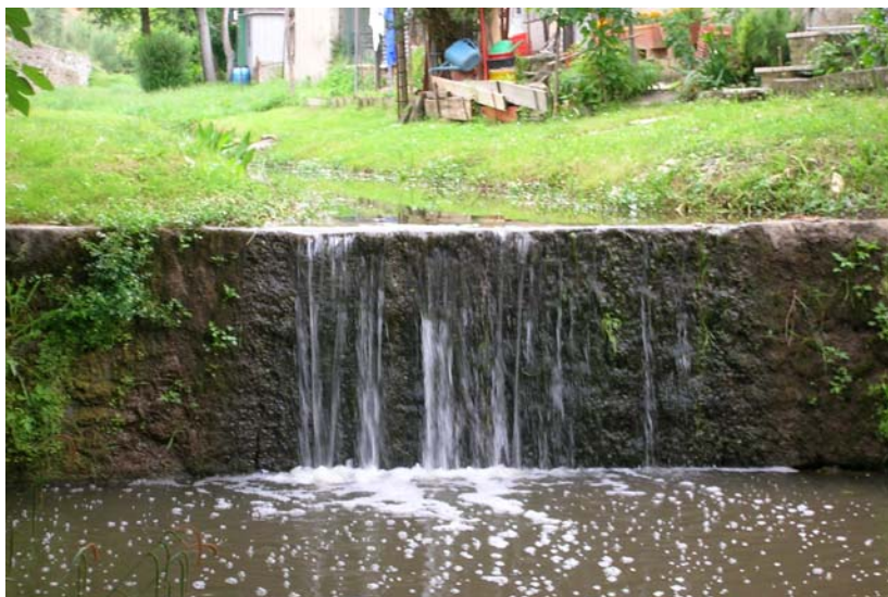
Foto 31 – T. Settola: briglia in corrispondenza della sezione SE2026B_ vista da valle