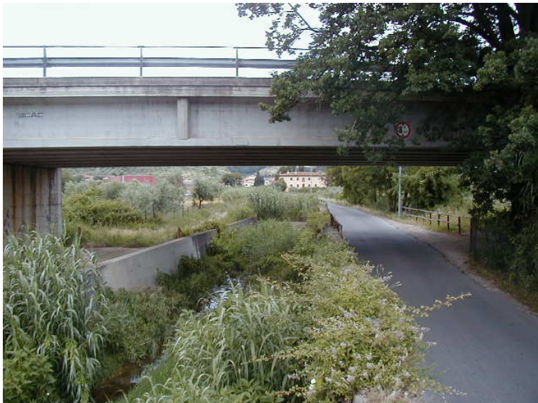
Foto 65 – T. Settola: tratto a valle della briglia alla sezione SE2064B_ ripresa dal ponte su via Berlinguer (SE2066__)