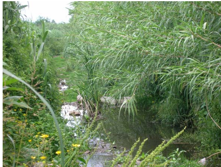
Foto 98 – T. Settola: briglia alla sezione SE2096A_ vista da monte