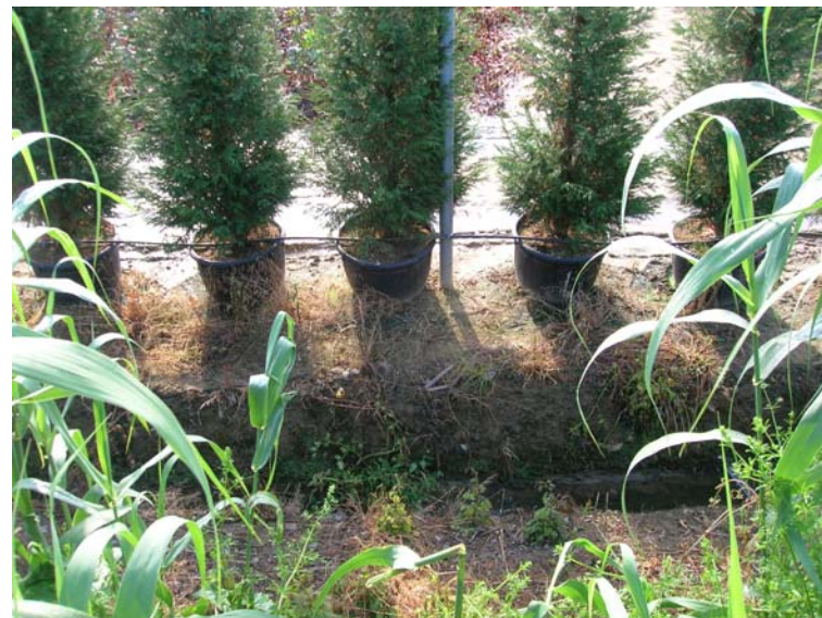
Foto 120 – T. Settola: foto dall'argine sx nell'area limitrofa alla SE2110__ sede di vivaio