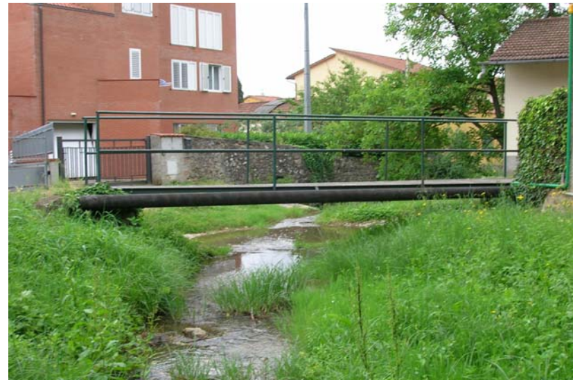
Foto 22 – T. Settola: attraversamento in corrispondenza della sezione SE2019A_ visto da monte