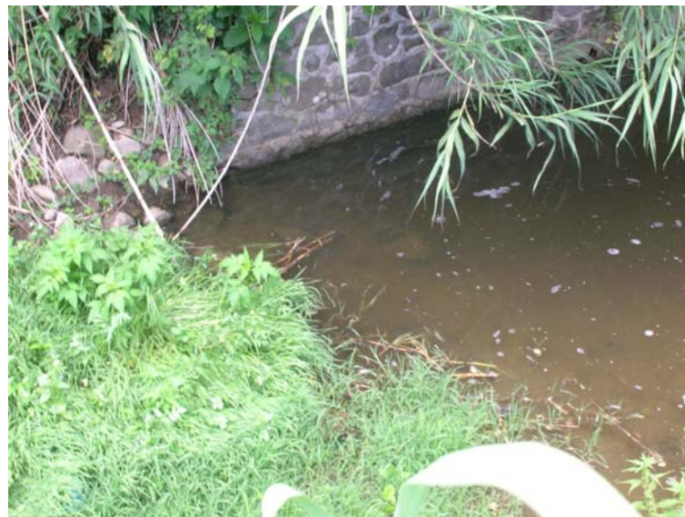
Foto 100 – T. Settola: sponda dx a valle della briglia briglia alla sezione SE2097B_