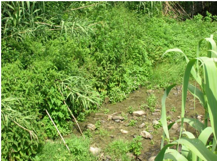
Foto 101 – T. Settola: punto di ripresa in corrispondenza della sezione SE2098__, da valle verso monte