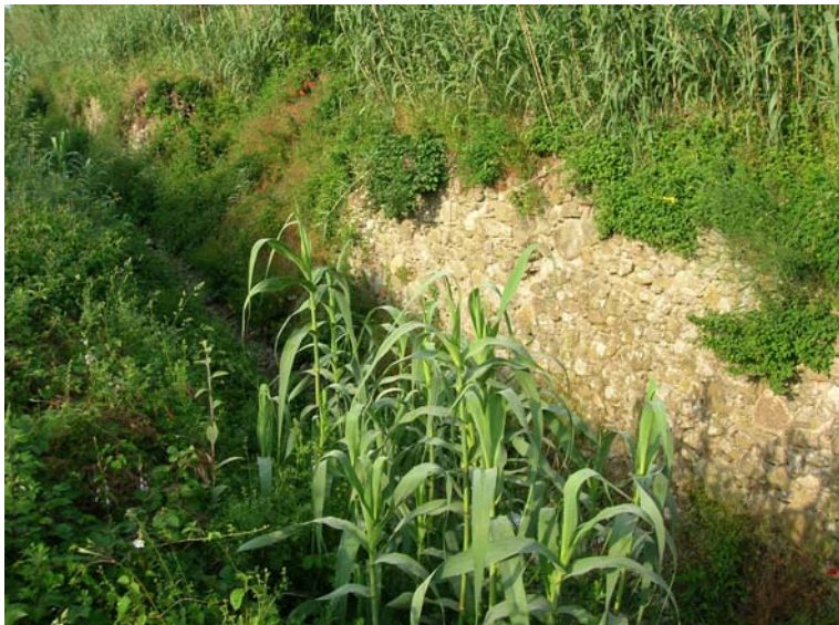
Foto 113 – T. Settola: punto di ripresa in corrispondenza della sezione SE2107__, da monte verso valle