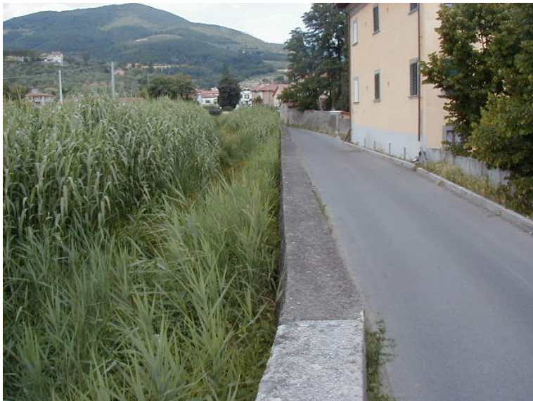
Foto 53 – T. Settola: sponda dx ripresa dalla sezione SE2053__ (da valle verso monte)