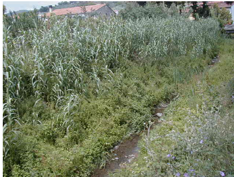
Foto 46 – T. Settola: punto di ripresa in corrispondenza della sezione SE2042__, da valle verso monte