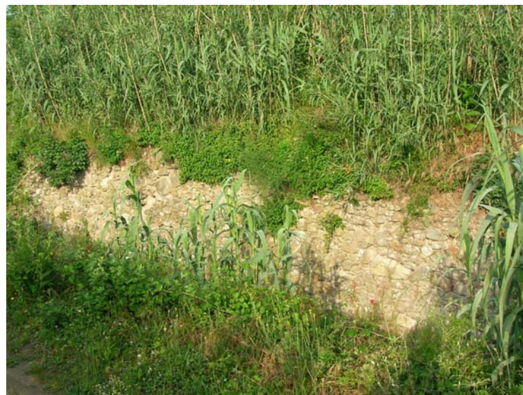
Foto 112 – T. Settola: muro di sponda in dx alla sezione SE2107__