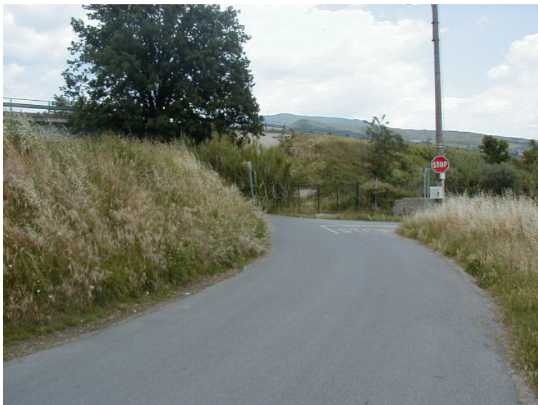
Foto 71 – T. Settola: argine sx a valle del ponte di via Berlinguer