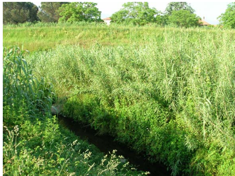
Foto 134 – T. Settola: punto di ripresa sull'argine sx in corrispondenza della sezione SE2120__ , da monte verso valle