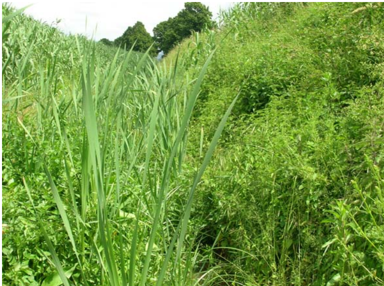
Foto 81 – T. Settola: punto di ripresa in corrispondenza della sezione SE2082__, da valle verso monte