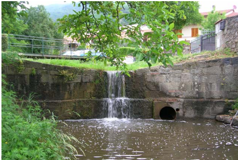
Foto 25 – T. Settola: briglia in corrispondenza della sezione SE2020B_