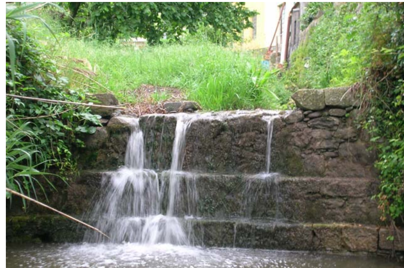
Foto 26 – T. Settola: briglia in corrispondenza della sezione SE2022B_