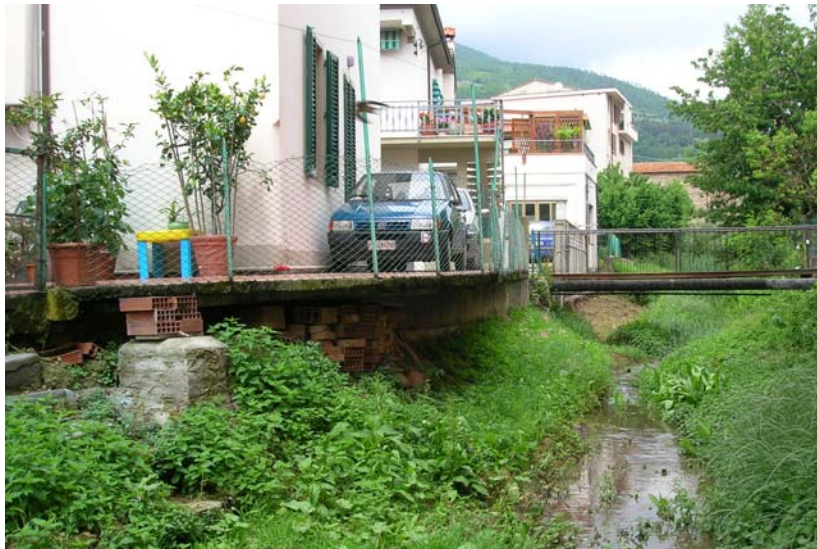
Foto 37 – T. Settola: tratto a valle della passerella di via Ferrucci (sez. SE2033C_)