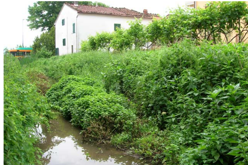
Foto 38 – T. Settola: punto di ripresa in corrispondenza della sezione SE2035__, da monte verso valle