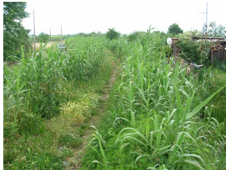
Foto 88 - T. Settola: punto di ripresa in corrispondenza della sezione SE2088__, da monte verso valle