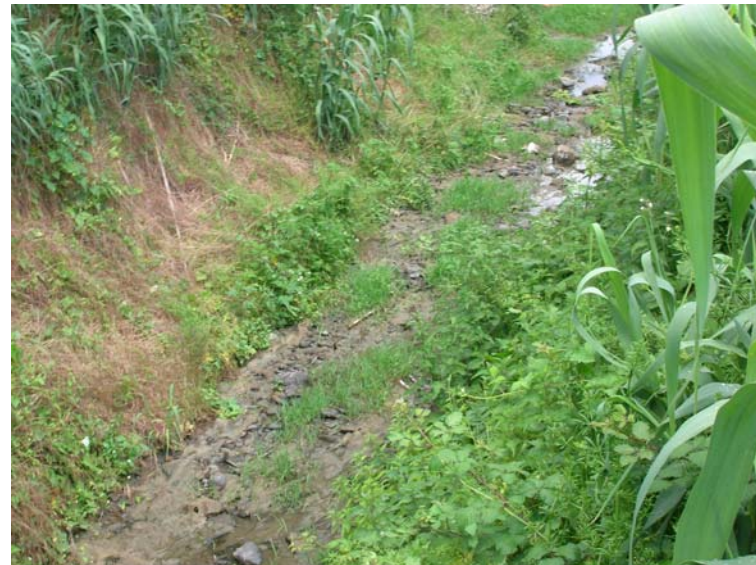
Foto 102 – T. Settola: punto di ripresa in corrispondenza della sezione SE2099__, da valle verso monte