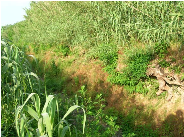
Foto 117 – T. Settola: punto di ripresa in corrispondenza della sezione SE2109__, da monte verso valle