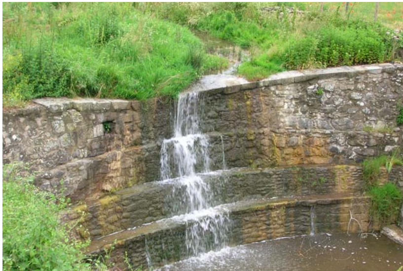
Foto 17 – T. Settola: briglia in corrispondenza della sezione SE2010C_