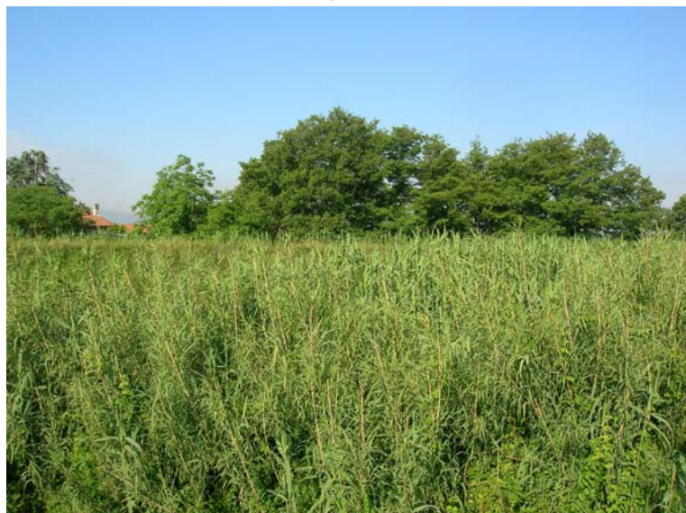
Foto 135 - T. Settola: area in dx vista dall'argine alla sezione SE2120__