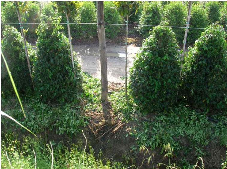
Foto 125 – T. Settola: foto dall'argine sx nell'area limitrofa alla SE2112__ sede di vivaio