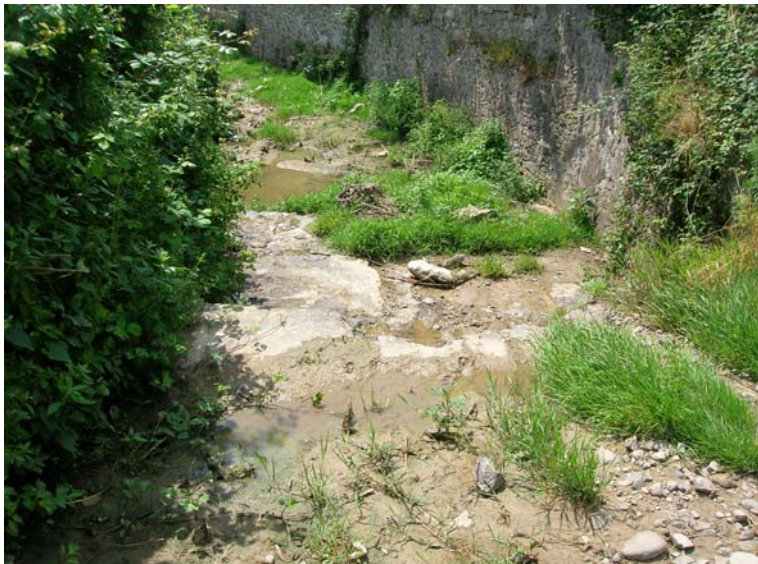
Foto 105 – T. Settola: briglia alla sezione SE2102A_ vista da monte