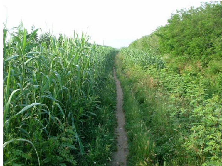
Foto 118 – T. Settola: punto di ripresa in corrispondenza della sezione SE2110__, da monte verso valle