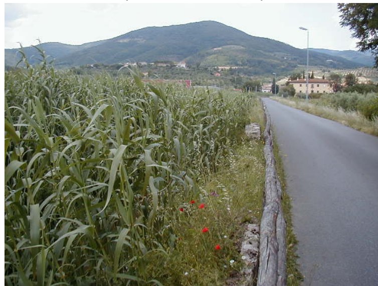
Foto 60 - T. Settola: sponda dx ripresa dalla sezione SE2061__ (da valle verso monte)