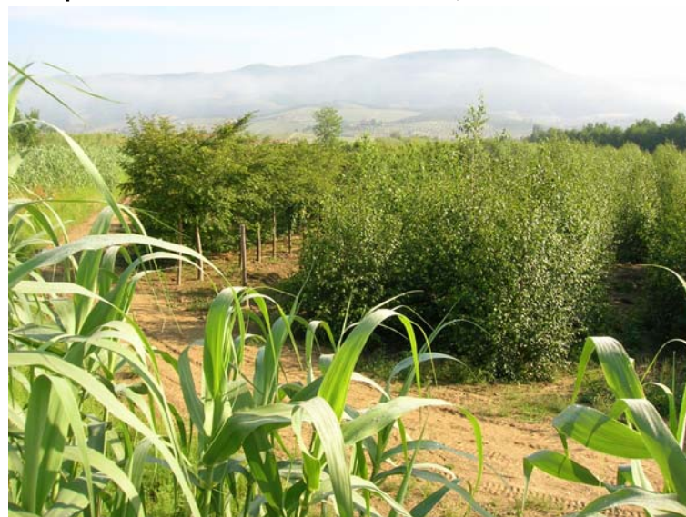
Foto 136 – T. Settola: area in sx vista dall'argine alla sezione SE2121__