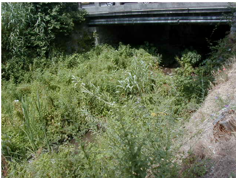
Foto 43 – T. Settola: ponte su via IV Novembre (sezione SE2039C_), visto da valle