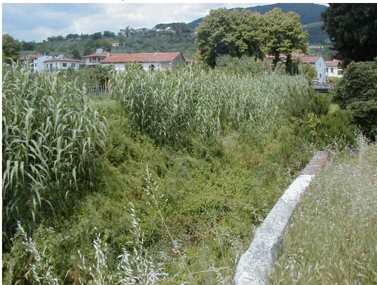
Foto 47 – T. Settola: punto di ripresa in corrispondenza della sezione SE2044__, da valle verso monte