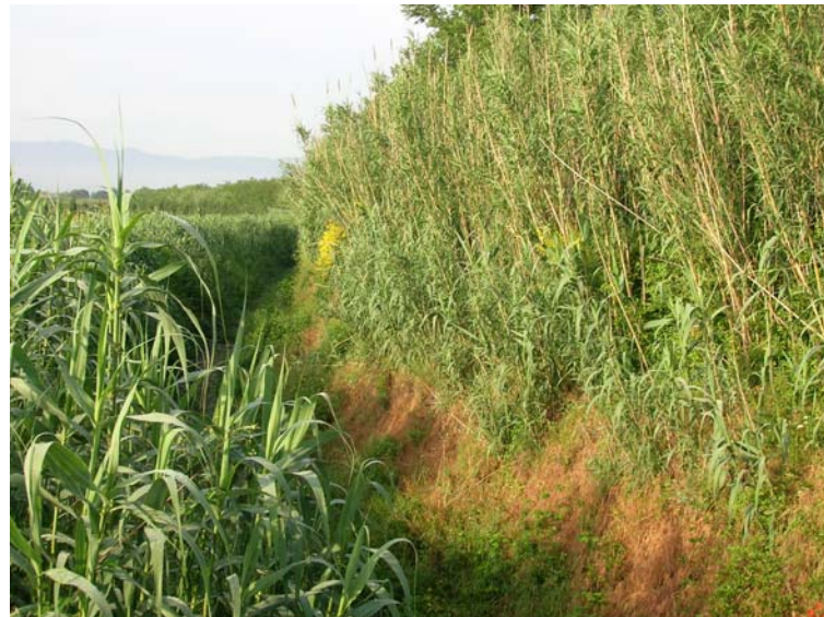
Foto 114 – T. Settola: punto di ripresa in corrispondenza della sezione SE2108__, da monte verso valle