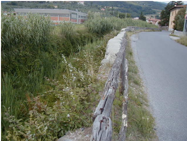
Foto 57 – T. Settola: sponda dx ripresa dalla sezione SE2057__ (da valle verso monte)