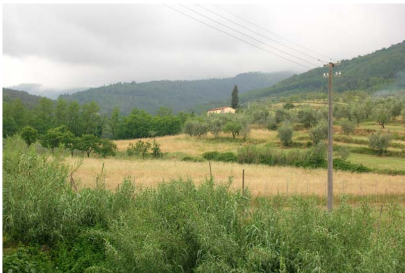
Foto 15 – T. Settola: area posta in sponda sx fotografata in corrispondenza della sezione SE2008__