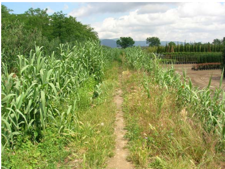
Foto 103 - T. Settola: argine sx alla sezione SE2100__ (da valle verso monte)