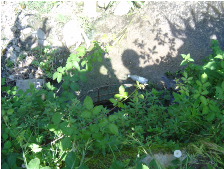
Foto 97 – T. Settola: opera di presa realizzata sull'argine sx all'altezza della sezione SE2095__