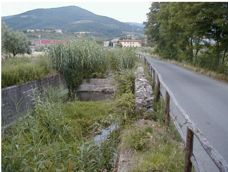
Foto 63 – T. Settola: tratto a valle della briglia SE2064B_ all'altezza della sezione SE2065__