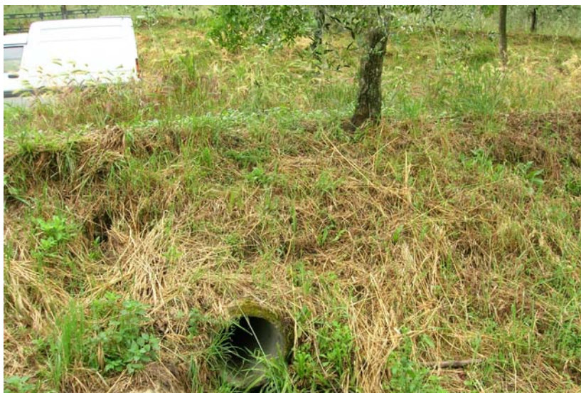
Foto 11 – T. Settola: scarico in sponda dx a monte della briglia alla sezione SE2007A_