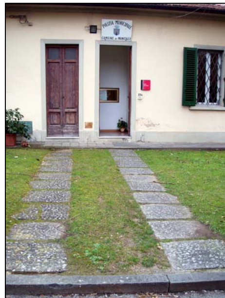
23. palazzina Vigili Urbani