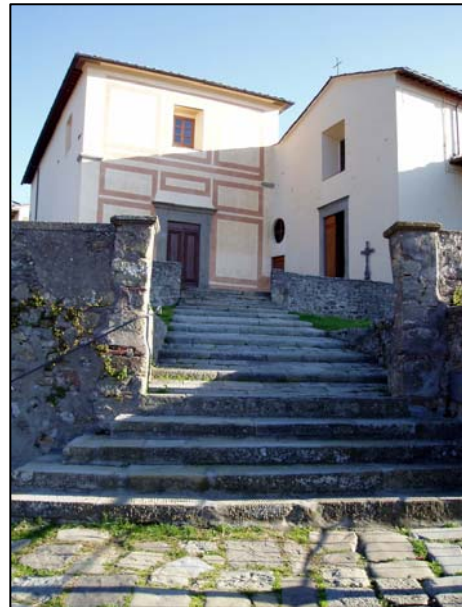
1. chiesa parrocchiale e "compagnia"