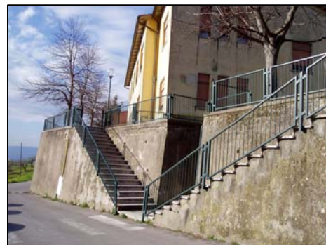
8. scuole primarie