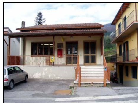
7. ufficio postale, Misericordia, corpo musicale G. Verdi