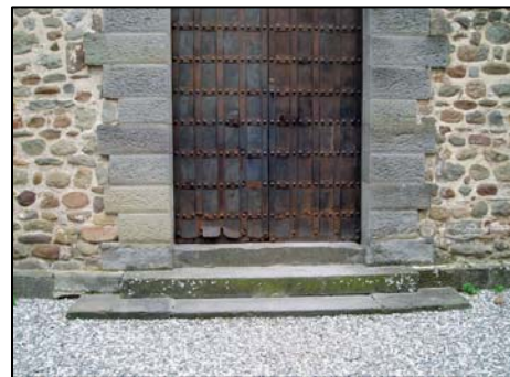
28. Badia S.Salvatore in Agna