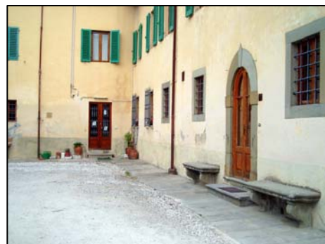
11. scuola materna privata