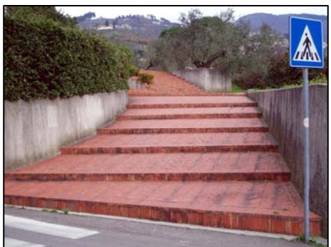
10. monumento Vivarelli