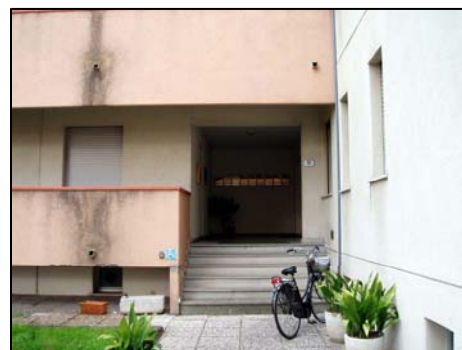
31. biblioteca comunale