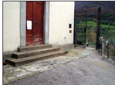
3. cappella cimitero