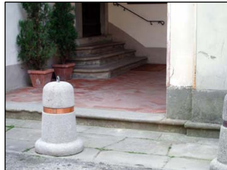
5. chiesa parrocchiale