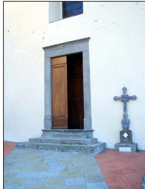
1. chiesa parrocchiale