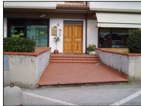
16. Banca Toscana