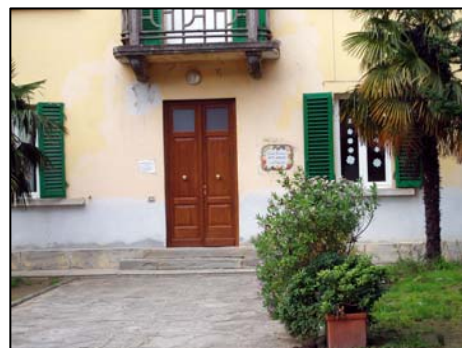
8. scuola elementare