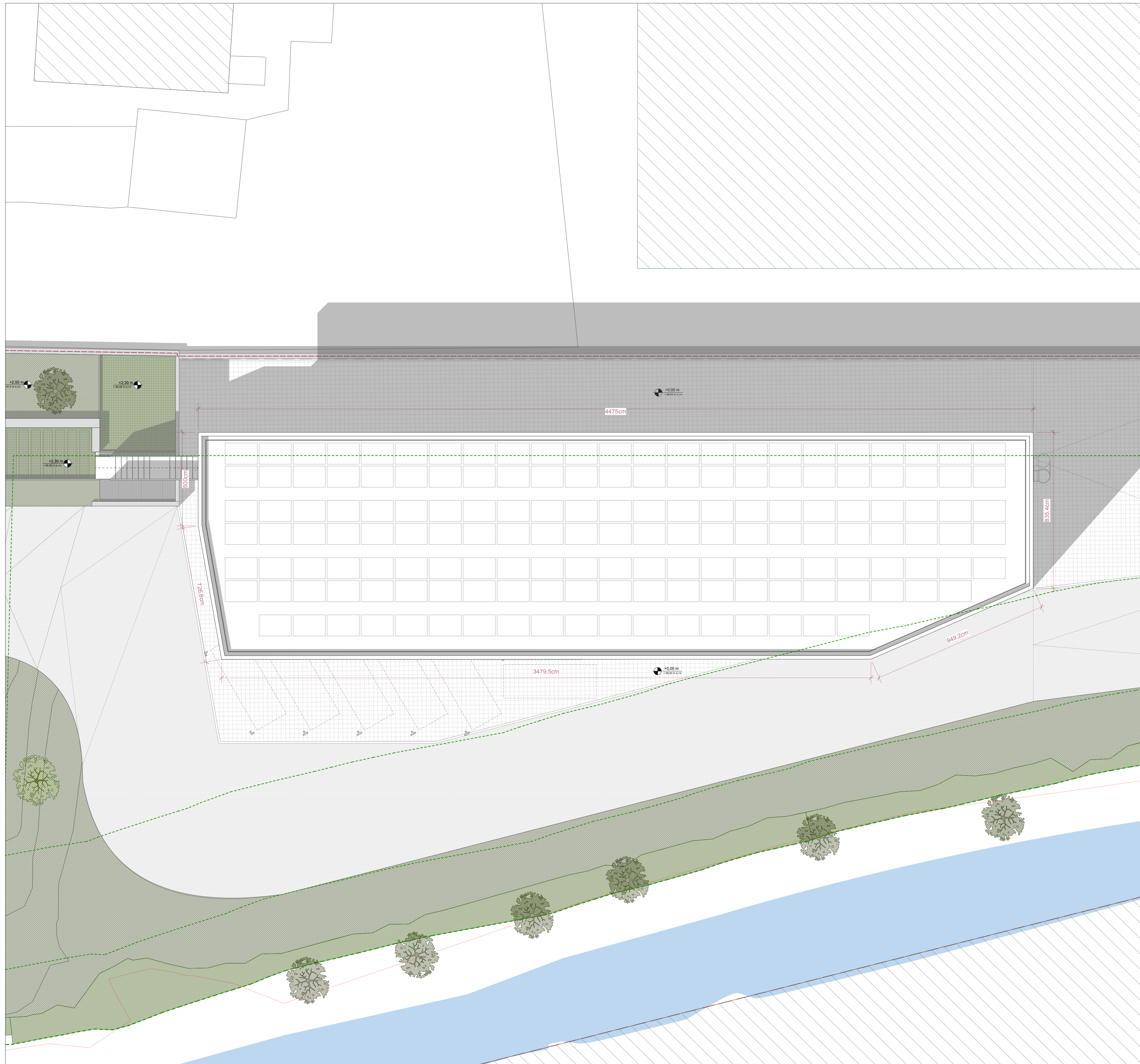
Pianta piano copertura Scala 1:100