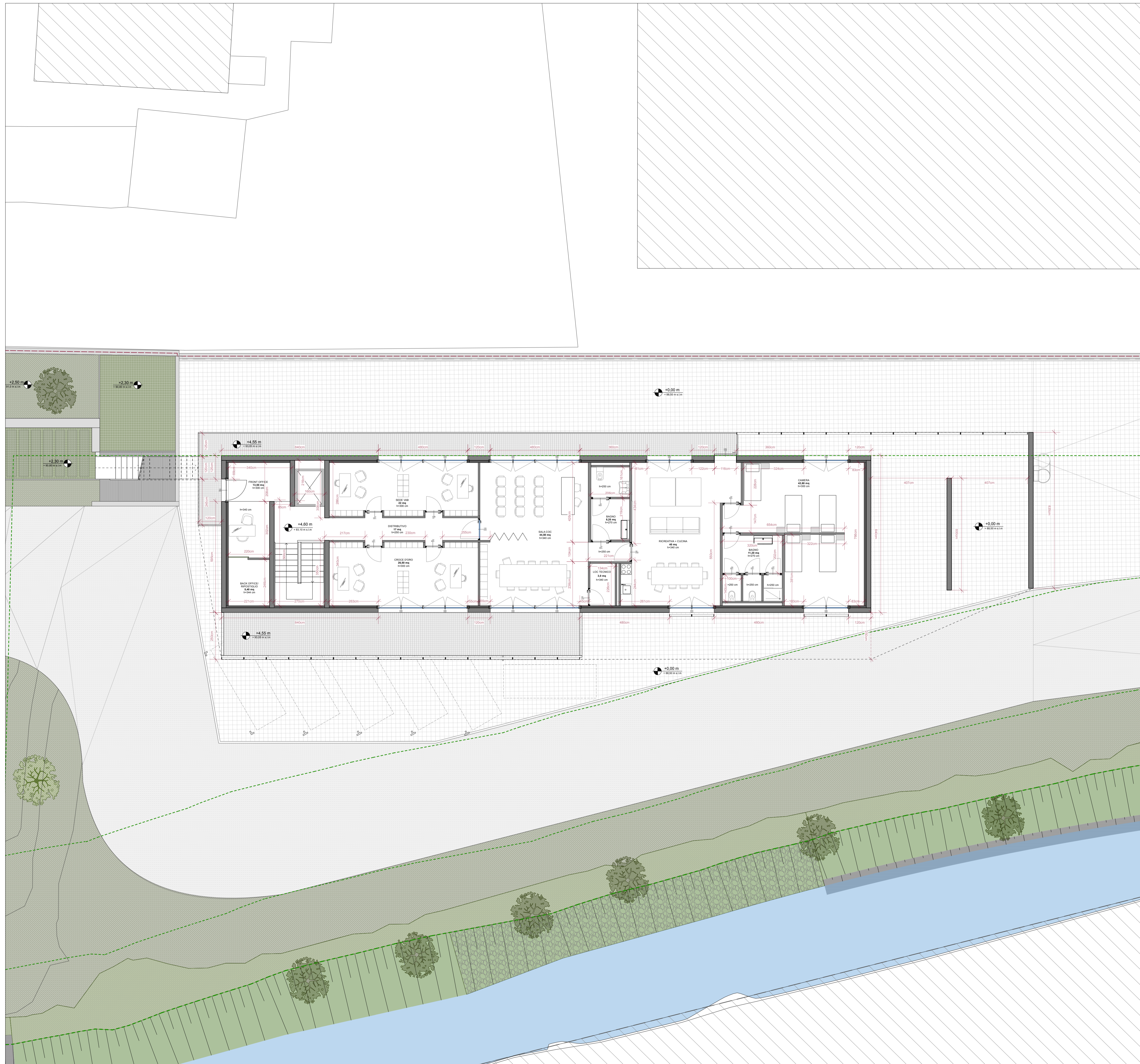
Pianta primo piano Scala 1:100