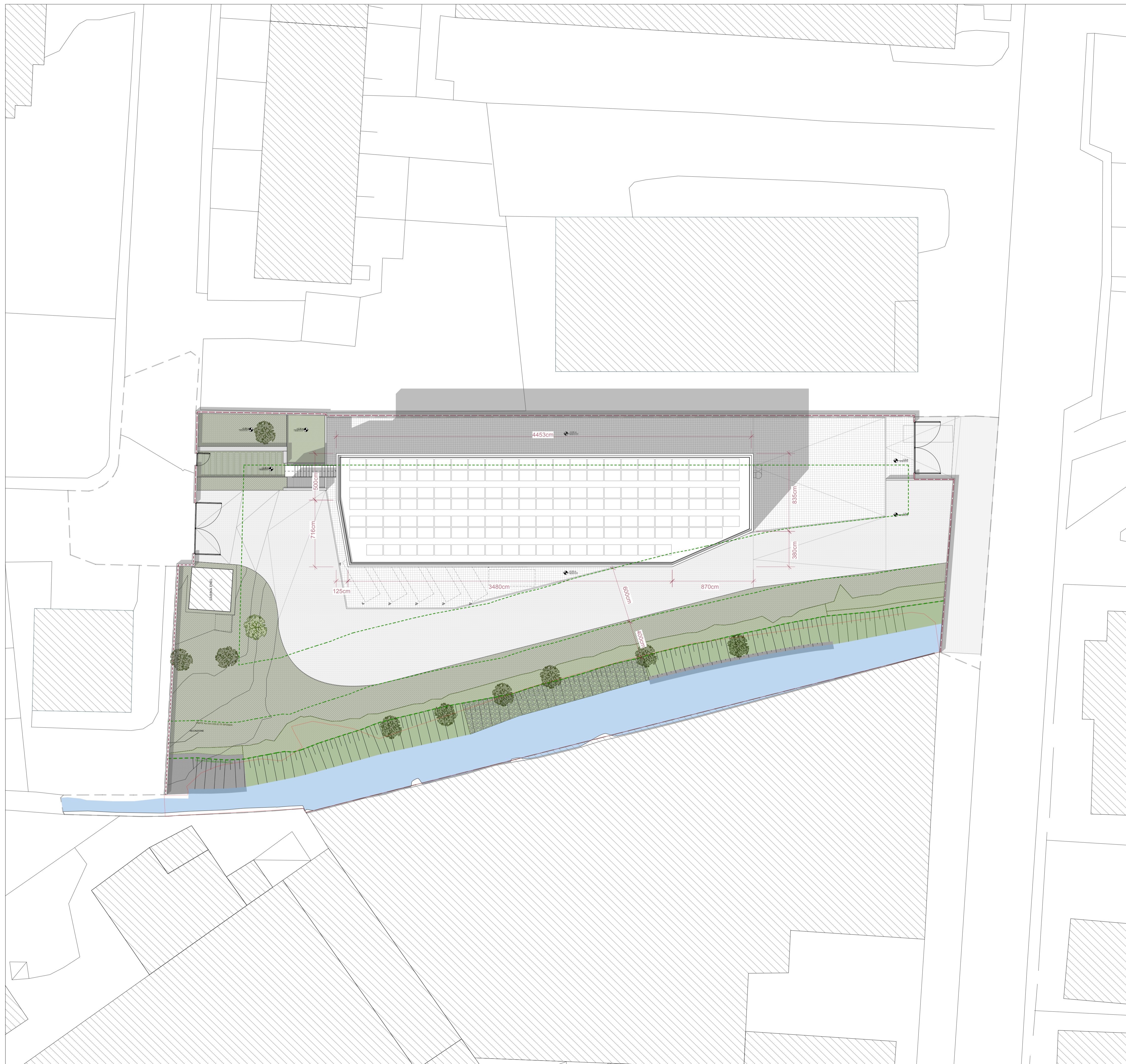
Inquadramento generale dello stato di progetto Scala 1:200